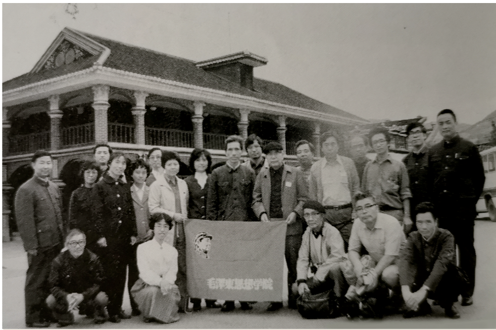
1982年，日本毛泽东思想学院创立15周年之际组团来华访问。图为访华团在遵义会议旧址合影