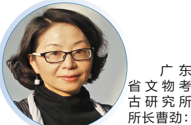
广东省文物考古研究所所长曹劼