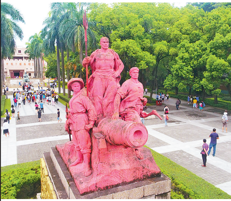
东莞虎门林则徐销烟旧址

在新时代，革命文物的活化利用要建立在扎实的、深入的史料研究基础之上。比如，我们做华南研学基地的前期研究，也是在浩如烟海的历史档案中，抽丝剥茧地寻找师生们在这段时期的经历。这些扎实的前期工作，直接启发了后期的活化利用工作，像信息库的设计、遗迹的修缮等，既有丰富的知识、可信的来源，又时尚有趣，效果非常好。沉浸式体验等更加活泼的方式能让年轻人更容易理解，也能更好地讲述蕴藏的红色故事。