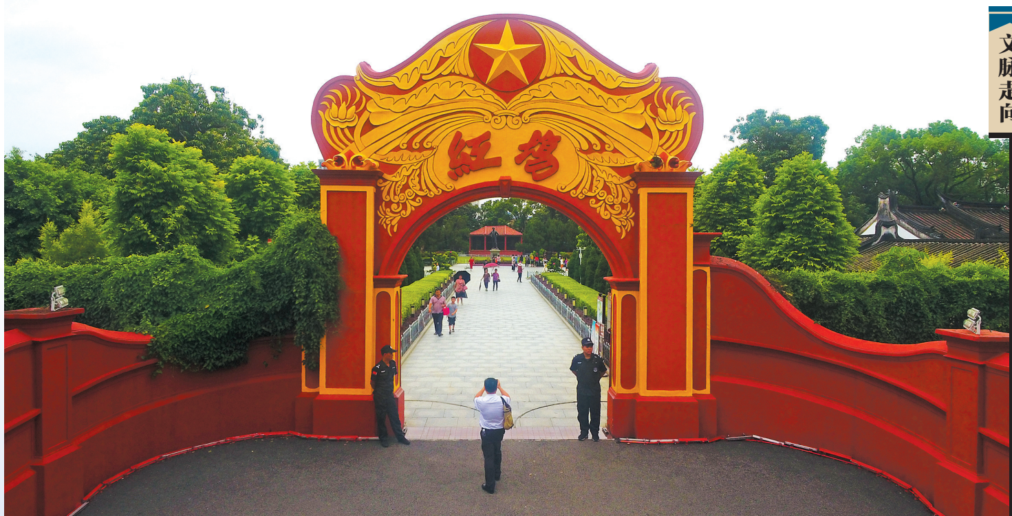
广东红色旅游受到游客欢迎

6月20日，中共三大会议纪念馆改扩建竣工开馆。党员、群众通过预约，纷纷走进纪念馆，体会近百年前革命先辈的筚路蓝缕。广州市恤孤院路的中共三大会议遗址广场上，留着98年前中共三大代表走过的足迹。南粤大地上，众多革命文物星罗棋布：红墙黄瓦的广州农讲所农民运动讲习班的上课声，似乎至今犹在人们耳畔回响；海丰红宫、红场旧址，见证了大革命时期彭湃领导的海陆丰革命斗争……这些革命文物，串连中国近现代革命史，展示着一段段峥嵘岁月和光辉历史，传承南粤百年红色基因。