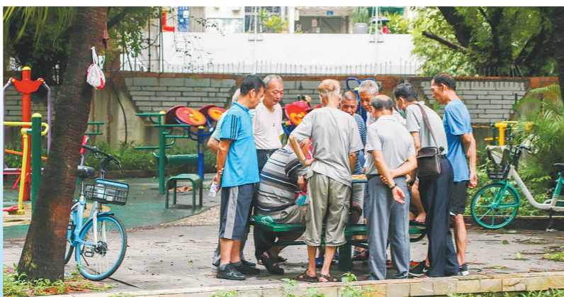
五羊社区居民常在休闲场所切磋棋艺(资料照片)