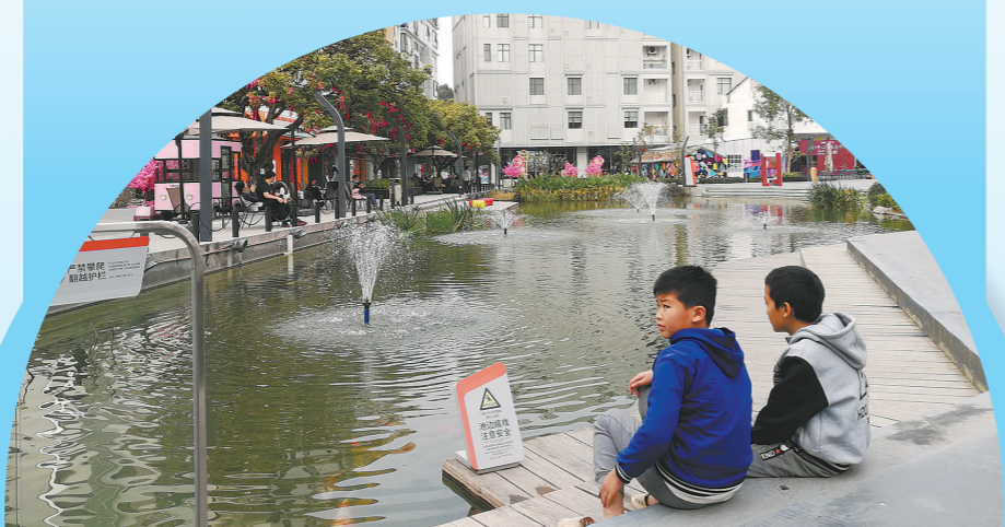
美丽的社区提供更丰富的休闲场所(资料照片)