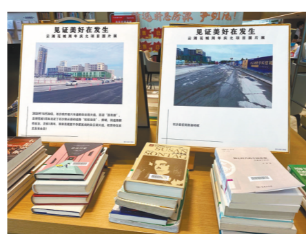
房企旗下项目内规划有社区图书馆 徐炜伦 摄