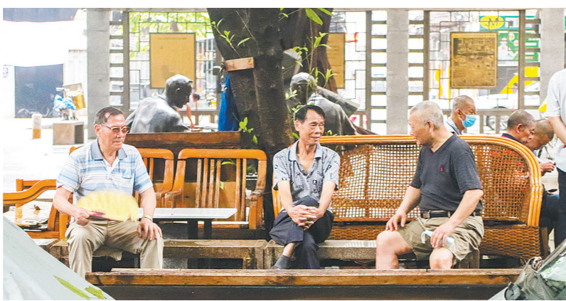
五羊邨邻里之间聊家常(资料照片)