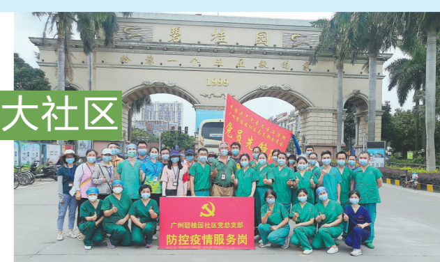
广州碧桂园社区党总支支部联合业主志愿者们和业主们一起抗疫防疫

为了降低低人员聚集的风险,广州碧桂园物业团队按照苑区对业主进行分时段检测安排:由凤凰管家通过朋友圈及业主群全天候发布检测安排通知;志愿者及物管安保人员不定时到每栋楼