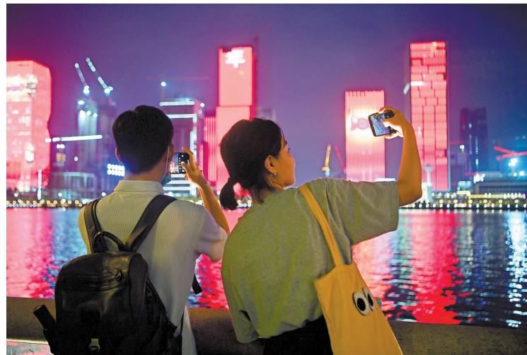
游人在江边用手机记录心动时刻