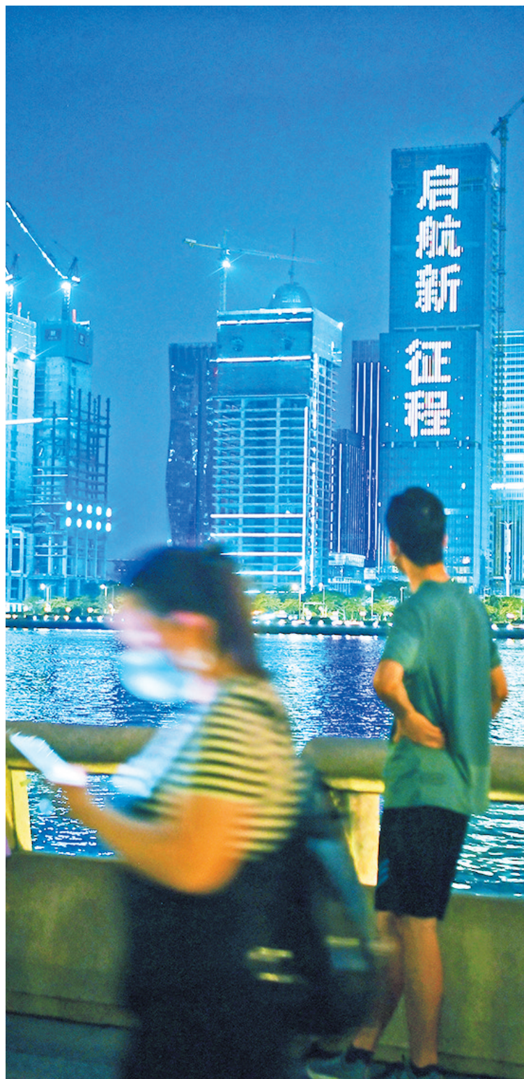
▲琶洲西区的灯光秀

在花城广场的一南一北,广州塔与中信广场相对,广州塔塔身显示红色金句,中信广场则呈现相应图像内容,作为广州的新老“最高建筑”地标,两塔隔空呼应,象征着改革开放初期与改革开放成果的对话,凸显广州这座城市的时代感和发展速度。