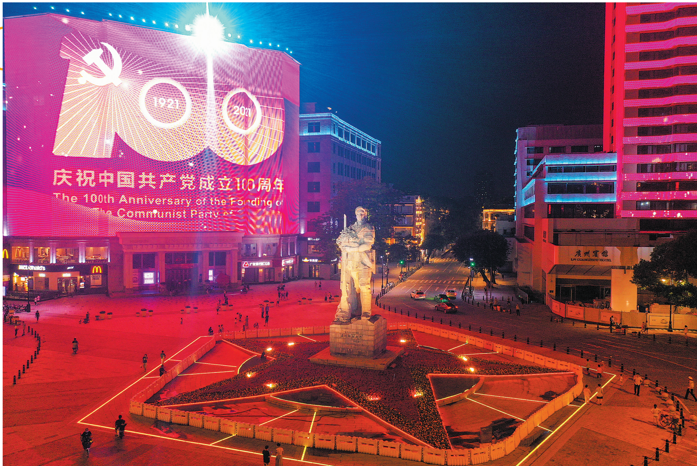
▲海珠广场“七一”主题灯光秀

6月28日晚,广州“七一”主题灯光演绎联动正式亮灯。今年灯光秀演绎以光影的形式,将时空高度浓缩,讲述党的百年历程。以一带(沿江路24栋建筑媒体立面、琶洲人工智能和数字经济试验区建筑媒体立面、海心沙、九座桥梁)、两轴(旧中轴-海珠广场、新中轴-轴线上所有媒体建筑)、三节点(广州塔、中信广场、北京路电子屏幕)演绎红色故事,展示党的红色足迹、红色地标和红色精神,让观众读懂党的历史、记住党的事迹、传播党的思想。