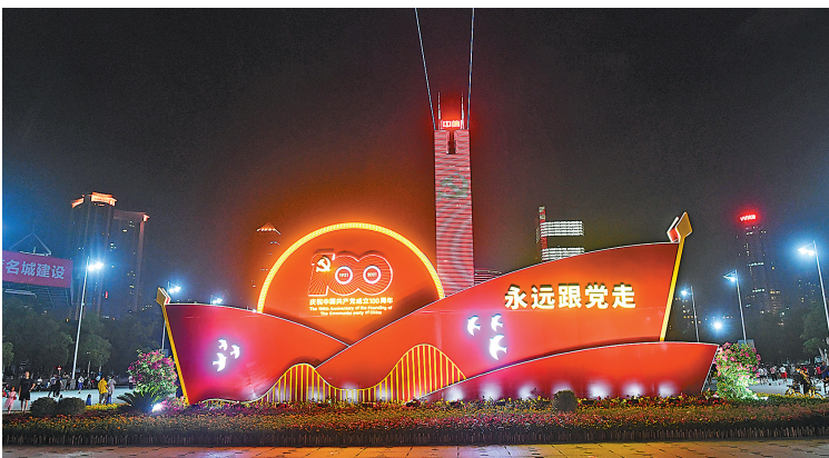
中信广场播放“七一”主题的灯光秀