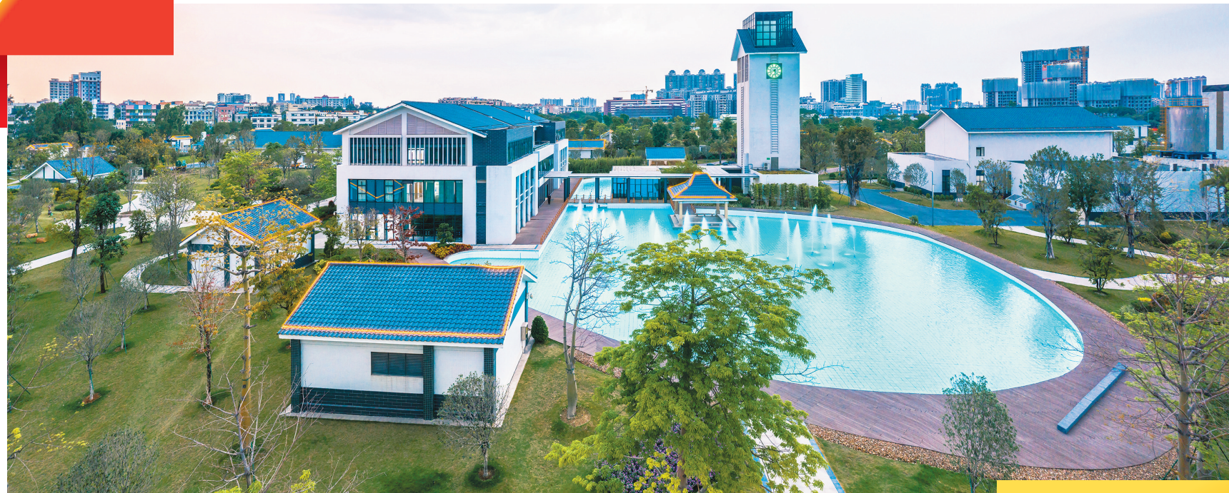
广州水投石井净水厂