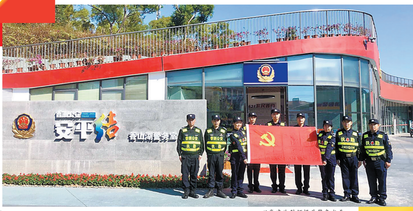
以党建为引领提升警务水平