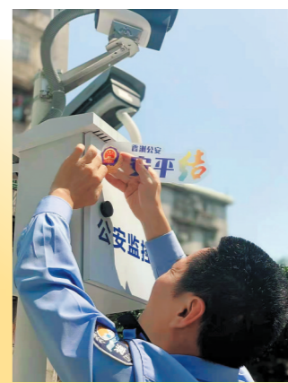
珠海香洲警方启动“安平结”计划

通过“党建+社会综合治理”新思路,珠海香洲公安分局把一件件看得见的实事落实在了实践活动中。据统计,今年上半年,该分局辖区违法犯罪警情同比下降47%,盗窃警情同比下降46.5%,入室盗窃警情同比下降82.9%,成效显著。