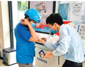
劳动者们在珠海建行的劳动者港湾可以歇歇脚、喝口水

在发展党员方面,珠海建行以“有利于党员教育管理、有利于促进中心工作”为原则,持续优化组织架构,设置5个党总支、50个党支部,旨在将基层党建基础打牢,做好党员与干部双向培养,有效消除党员“空白点”,进一步提高干部队伍市场竞争力。据悉,2020年,珠海建行新发展党员共28名,其中