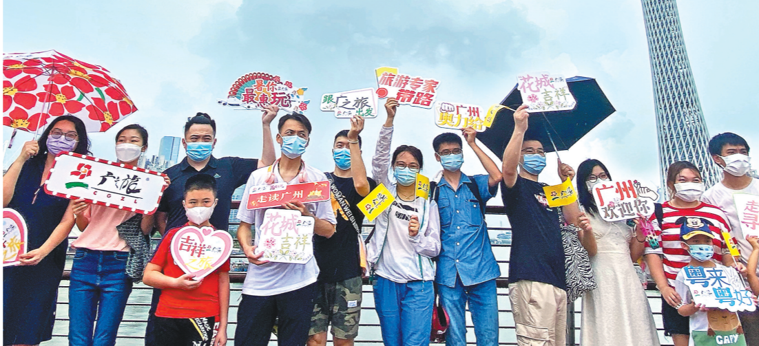
游客在海心桥上欢乐合影

羊城晚报讯 记者刘星彤报道：截至7月2日24时，广州已连续14天无新增本土病例，全市11区均为低风险地区，广州本轮疫情防控迎来阶段性胜利，本地文旅市场也终于在期盼中迎来本轮疫情后首个出发的市内旅游团。 3日下午，由广之旅组织的20名市民在二沙岛海心桥附近抢鲜出发，参加“走读广州”最新线路——“海陆空”全新视觉广州半天游，以绿色、低碳的方式，行走于花城广场、海心沙公园、钻石艺术公园，并打卡海心桥、广州塔等城市新地标，同时