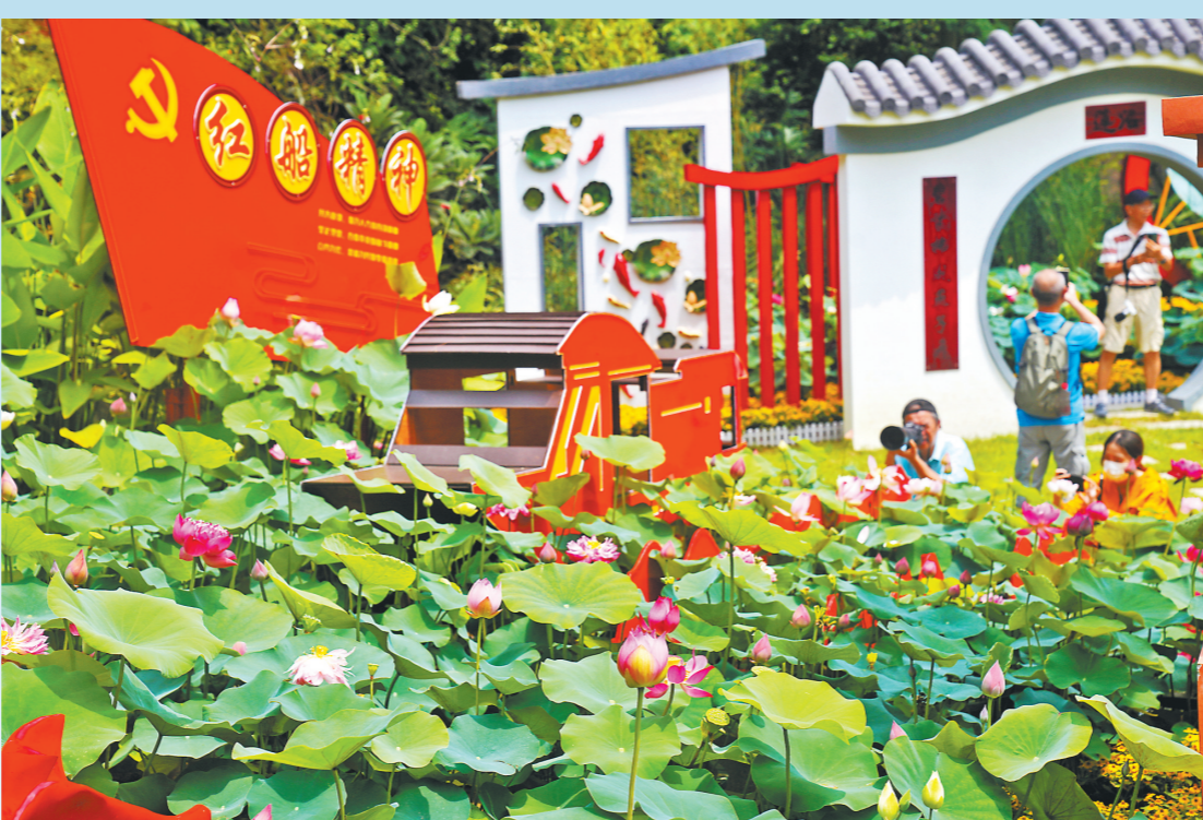
莲花山引进培育的“中国红”系列

库存回笼资金，又能增加市场此类住房供应。 意见还细化了金融政策支持，简化了审批流程，明确给予中央补助资金支持，落实了民用水电气价格政策。陈琳表示，意见的出台对新市民、青年人以及对城市而言都是利好。广州其实已经开始积极探索，例如广州的国有住房租赁企业珠江住房租赁、越秀住房租赁和广州城投住房租赁等，已有类似的租赁产品入市。 她同时认为，对于要多方共同建设保障性租赁住房，还需要政府制定更详细的指引细则，“比如是否会给予相关企业更切实的金融支持、土地政策支持、税务支持等，如此才能激发企业建设此类住房的积极性，也才能让这一产品的供应更可持续。”