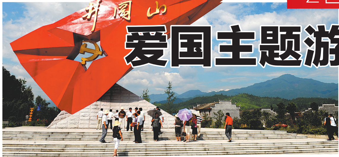
游客在井冈山红旗雕塑前参观