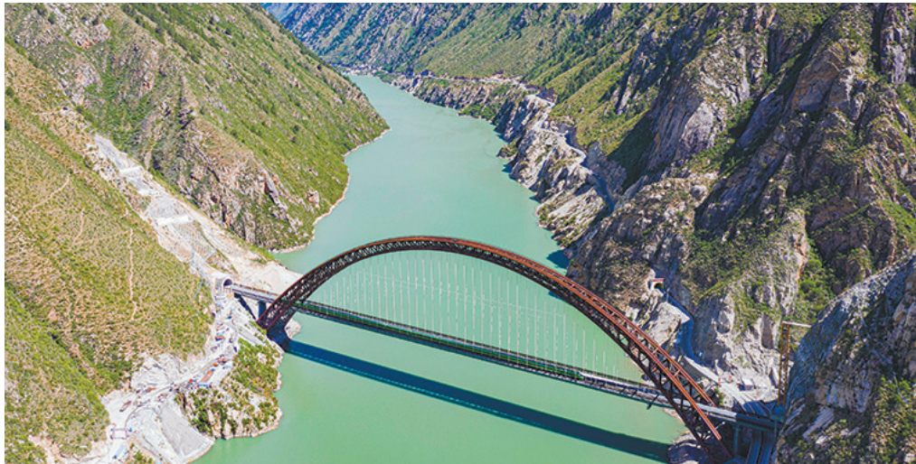
拉林铁路沿线峡谷美景