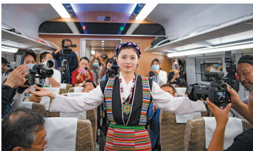
拉林铁路通车列车员进行当地服饰表演

植物界大熊猫的黄牡丹在每年五六月绽放。 岗嘎:位于米林县羌纳乡,雅鲁藏布江从这里蜿蜒而过,其周边有羌纳寺等景点,特别适合林间漫步。 林芝:林芝火车站位于巴宜区布久乡孜热村,距市区约19公里,距米林机场30公里。