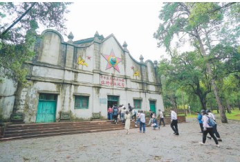
江西瑞金第二次全国苏维埃代表大会会址

马蜂窝旅游发布的《旅游新国潮》大数据报告则对95后人群的红色旅游玩法作出描绘:到长沙游览,他们不仅要打卡众多网红地,一定也会到橘子洲头走一走;去贵州不仅会去荔波小七孔避暑游玩,也要到“中国天眼”一睹“大国重器”之威;到青岛看海、寻迹中国“五渔村”时,也要去中国人民解放军海军博物馆一览人民海军建设发展的历史性成就。