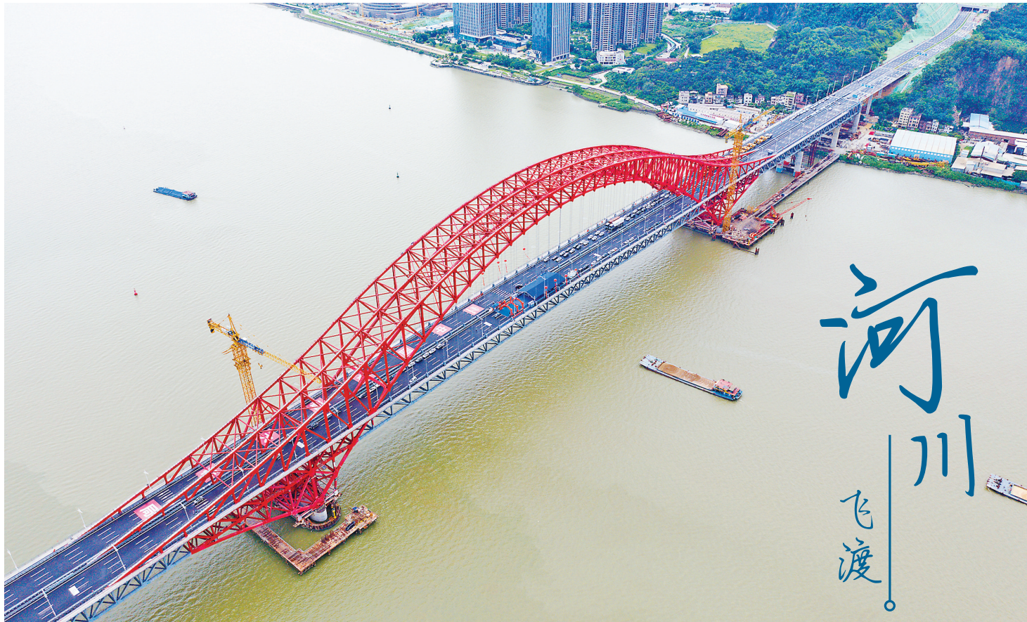
6月28日,广州南沙区明珠湾大桥正式通车,将使南沙城市核心区交通辐射能力实现新跃升,加快推动南沙由大湾区几何中心向交通枢纽中心转变。