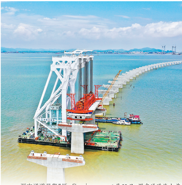
深中通道是集“桥、岛、隧、水下互通”于一体的跨海集群工程,建成后 will 有效释放现有路网压力,推动粤港澳大湾区主要城市间1小时生活圈形成。