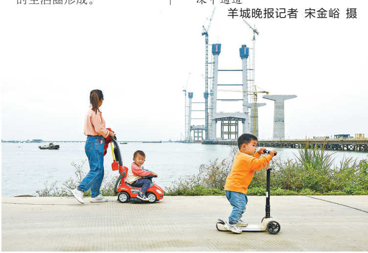
市民在岸边远眺建设中的深中通道