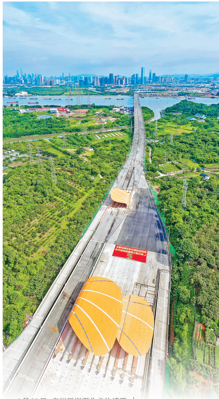
6月28日,广州新洲至化龙快速路北段工程顺利建成通车,标志着新化快速全线开通。