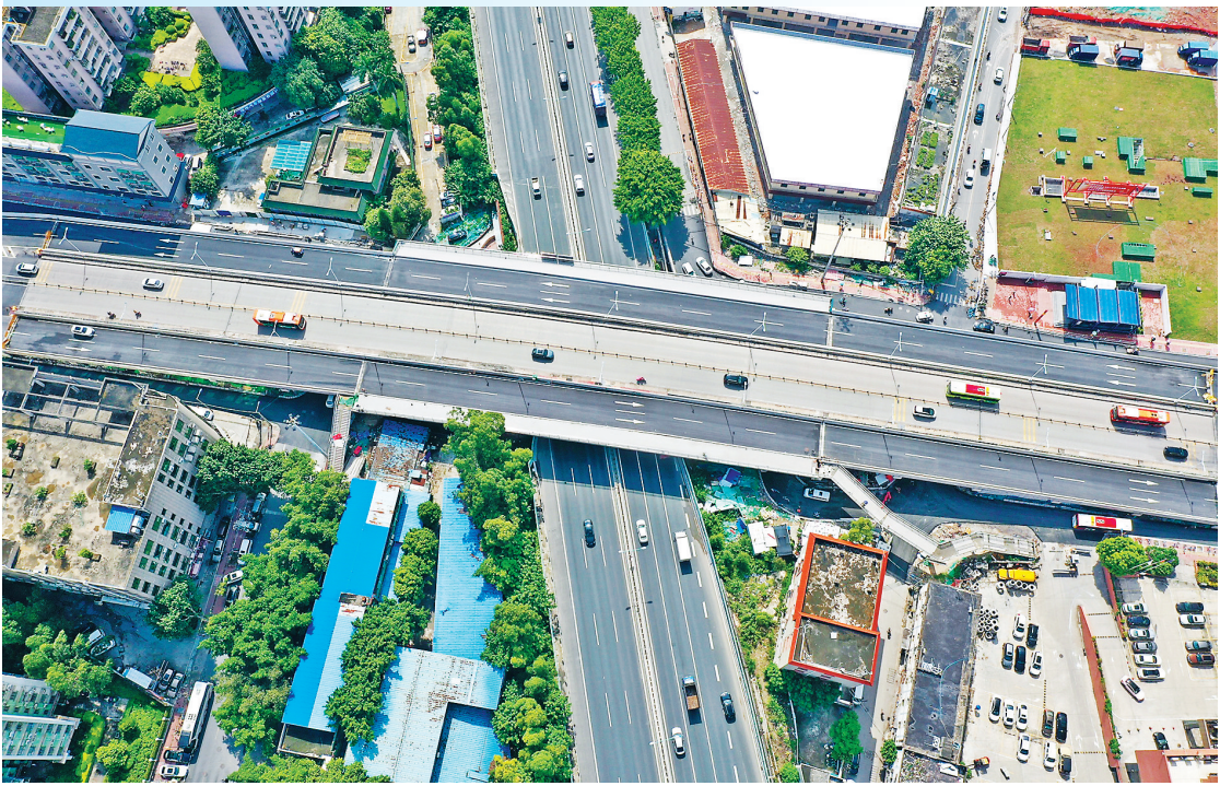
广州市白云区同德围西槎路的上坡桥拓宽工程项目现已完工,于7月1日通车。该工程解决了旧桥原有通行能力严重不足的问题,打通了西槎路交通瓶颈节点,提高了同德围地区的交通通行能力。