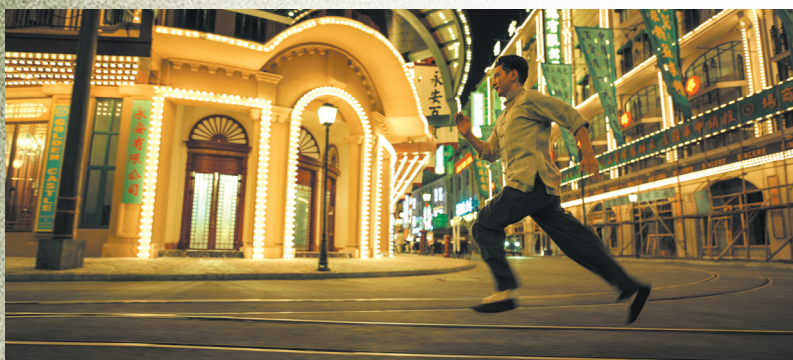
王仁君为演毛泽东苦练跑步

因影片题材的特殊性,不少观众对《1921》期待颇高。目前,该片在电影购票平台猫眼和淘票票分别得分9.5分和9.3分,说明大众对其较为满意。但其豆瓣评分为6.7分,说明在影迷心中,该片的艺术品质仍有上升空间。综合观众评价,《1921》富有诗意和激情的年轻化叙事方式最受观众赞赏,但影片难以在两个小时的电影空间里完美处理较多的人物和线索,成为最令人遗憾之处。