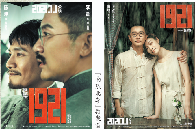
李达王会悟伉俪共同为理想而奋斗