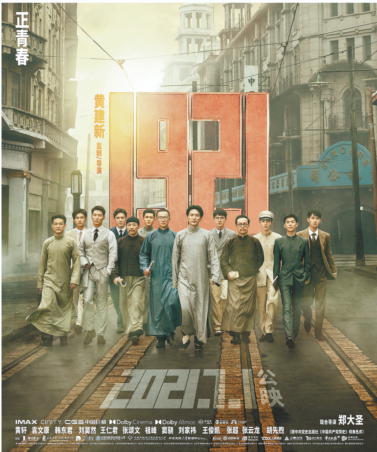
《1921》终极海报洋溢青春激情