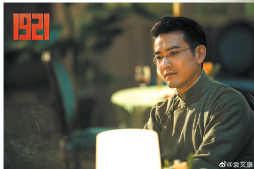
袁文康饰演李汉俊

值得一提的是,曹郁常常在演员表演情绪达到高潮时,扛着摄影机就冲进表演现场抓拍特写。这也是《1921》中不少“沉浸式”影像的来源,观众能随影片镜头进入中共一大现场,身临其境地感受建党时刻。