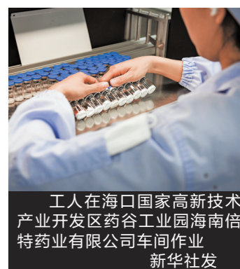
工人在海口国家高新技术产业开发区药谷工业园海南倍特药业有限公司车间作业

该《指导意见》的出台,对我国从事Me-too药物研发的企业提出了更高要求。所谓Me-too药,是指仿照了原研药但又改变原药的化学结构、具有知识产权但其药效和原药物相当的同质化研发药物。这类药物的出现,有助于丰富市场的产品选择,进行降低患者的用药负担和医保支付压力,但如果同类靶点研发扎堆,也可能导致临床资源和资金等的浪费。而《指导意见》则更加鼓励做到Me-better甚至Me-best,即要在仿制中创新,比原研药更好,更具治疗优势,从而实现新药研发的根本价值——解决临床需求,实现患者获益最大化。