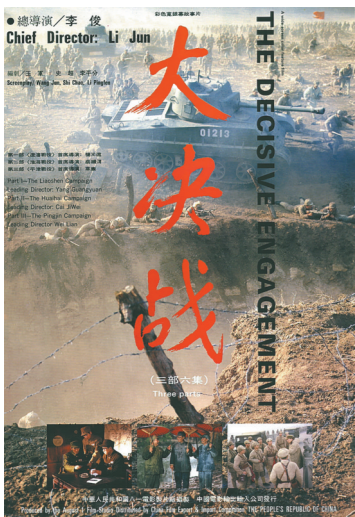
电影版《大决战》海报