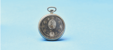
广州起义工人赤卫队用过的孙中山头像怀表