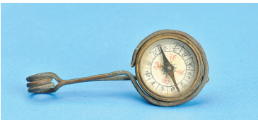
广州起义工人赤卫队用过的“上海永昌”指南针

为纪念这次起义，维新路改名为广州起义路。广州起义纪念馆就坐落在这条路上，里面珍藏的革命文物向人们诉说着当年的惊心动魄。