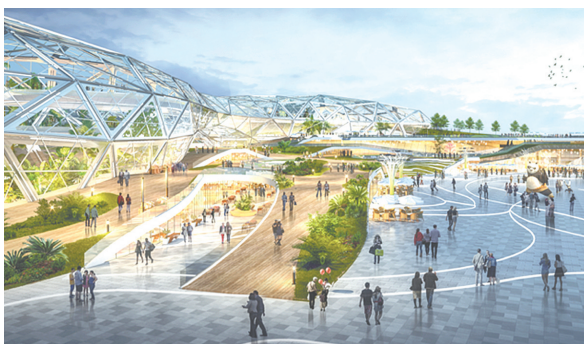
综合服务区西花街(效果图)