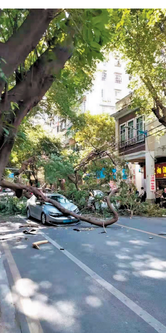
倒树压中两辆过路小车

人员的损伤。据悉，事发后很快有园林抢险人员到场，对倒下行道树的枝干部分进行清理，在清理期间东华西路东川路至较场西路双向行车一度受阻。 有街坊告诉记者，上月底，本次倒下的树旁，一棵行道树曾被修剪过，希望有关部门能够经常给所有的行道树进行“体检”，“这回只是压到车，如果树倒下时压到人，后果不堪设想。”