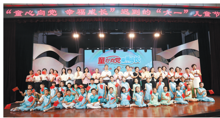
一线抗疫人员代表的子女收到迟来的“六一”儿童节礼物

来自公安、医护、社区等行业的一线抗疫家庭代表、广州市家庭代表、支持抗疫社会力量代表等百余齐聚一堂，共话抗疫故事，共度迟到的“六一”儿童节。