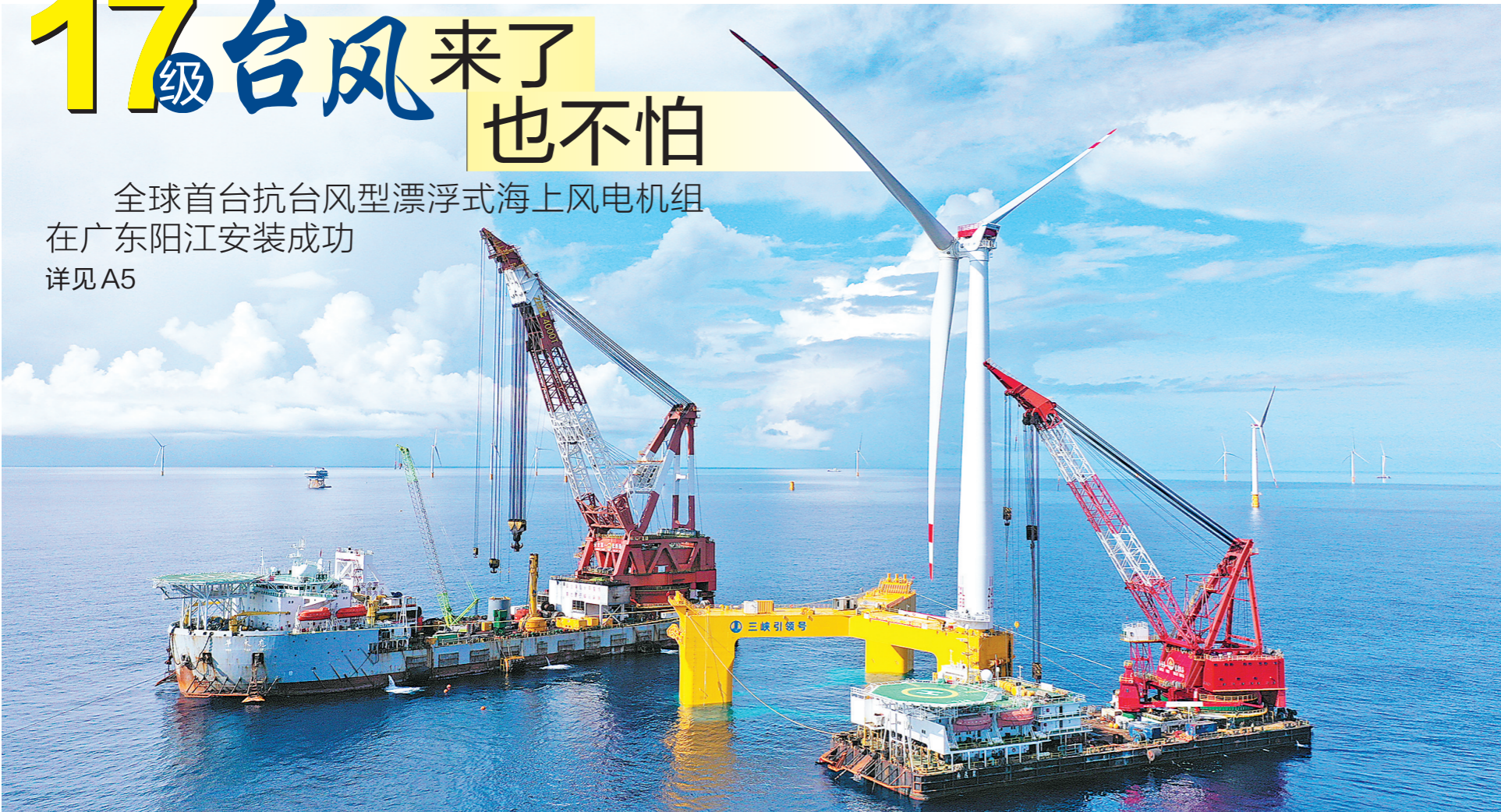
全球首台抗台风型漂浮式海上风电机组单机容量5500千瓦，每年可为3万户家庭提供绿色清洁能源