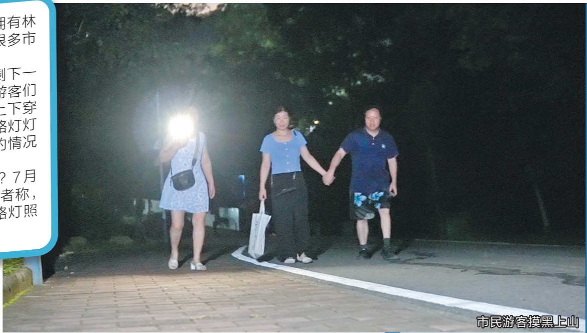
市民夜游摸黑上山

位于广州市天河区东北部的火炉山森林公园，因拥有林木繁盛的自然风貌以及经典的户外徒步路线，吸引了很多市民游客前去游玩。然而，全天开放的火炉山森林公园，入夜后却只剩下一片漆黑。近日，羊城晚报记者走访看到，夜色下，市民游客们手持手电，循着灰色的环山公路，在黑暗黢黑的公园里上下穿行。在环山公路的两侧，每隔数十米就有蓝白相间的路灯灯柱，但没有散发出一丝光亮。据附近居民反映，这样的情况已经持续多年。市民游客摸黑上山，安全如何保障？路灯何时能亮？7月13日，天河区森林资源管理中心的相关负责人回应记者称，目前已制定“充分利用现有灯杆灯杆设施，尽快恢复路灯照明功能”的工程设计方案，之后将加快建设实施。