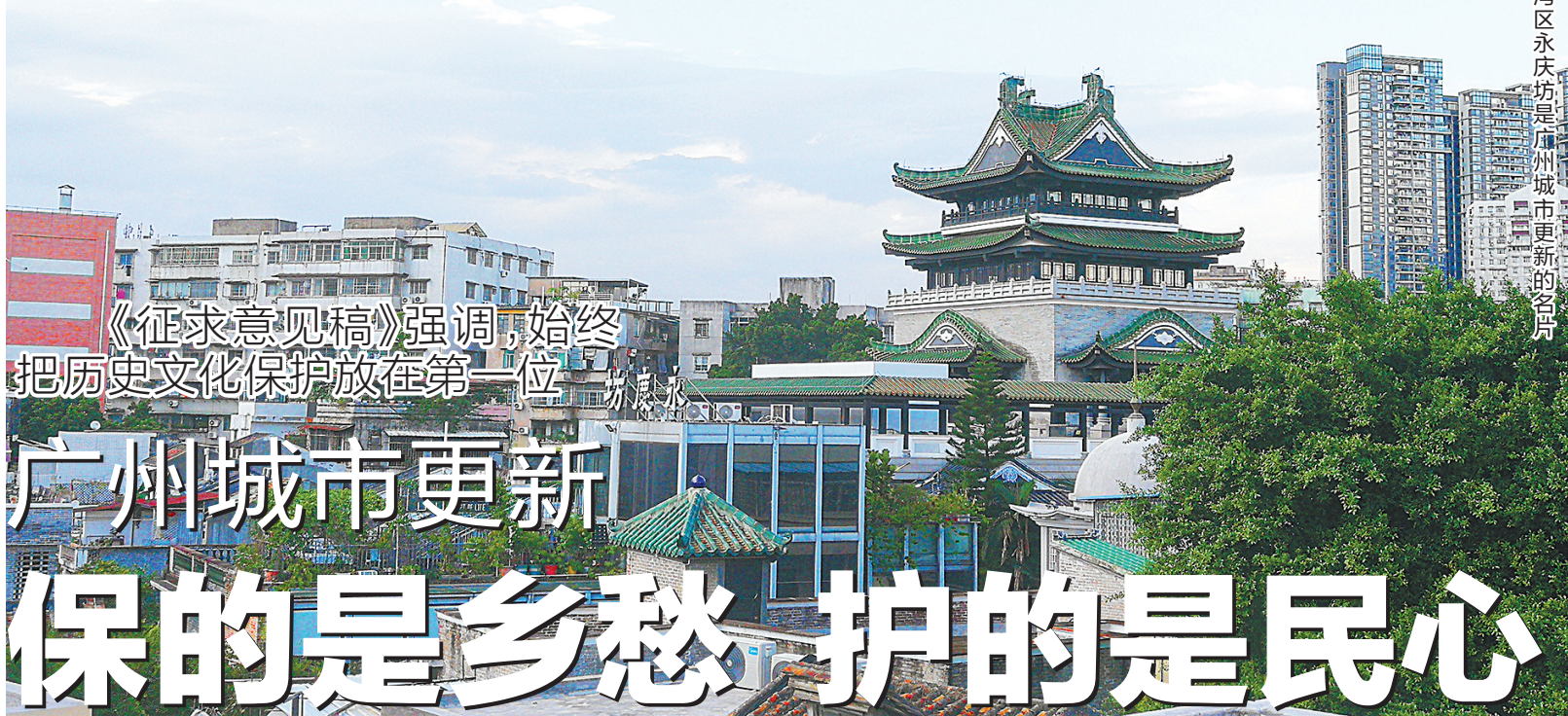
荔湾区永庆坊是广州城市更新的名片

《征求意见稿》共八章五十三条,羊城晚报记者留意到,提及“历史文化保护”的条款有7条、次数有8次之多,在广州城市更新中,历史文化保护始终被放在第一位。在历史名城和千年商都广州,保护的是历史文化,守护的是这座城的乡愁民心。