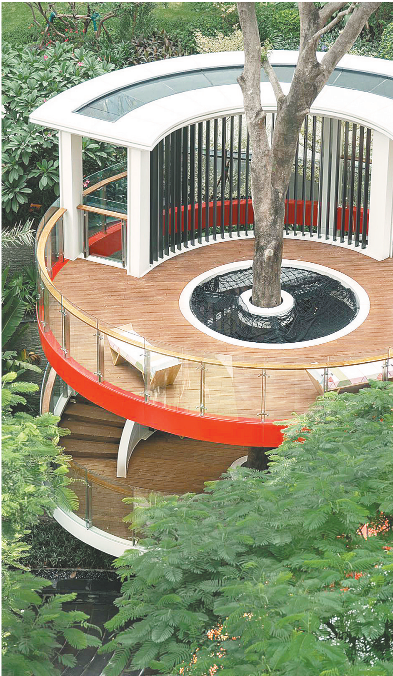
建筑与自然和谐共生

“广州又称‘花城’,我对未来社区的憧憬是:开门见到鲜花绿植、开窗听到鸟的声音,人们亲近自然,与自然和谐共生。”巴索说。