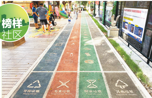
寓教于乐的垃圾分类主题跑道