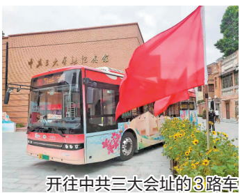
开往中共三大会议址的3路车

记者16日在发布现场看到，3路车主题车厢内设有讲解二维码，乘客扫码观看线上讲解，普通公交车变身成为“家门口的红色课堂”。此外，一汽巴士还组建了志愿讲解团，在节假日期间为乘客提供生动的讲解。中共三大会议址纪念馆是广东