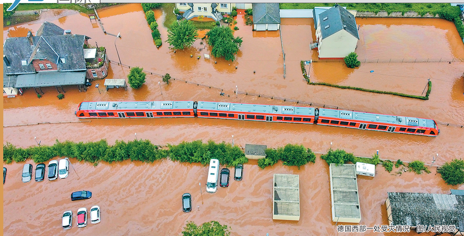
德国西部一处受灾情况图

德国和比利时因持续暴雨发生严重洪灾，截至15日，共导致至少数十人死亡，另有上千人下落不明。荷兰、卢森堡和法国同样遭遇不寻常的强降雨。