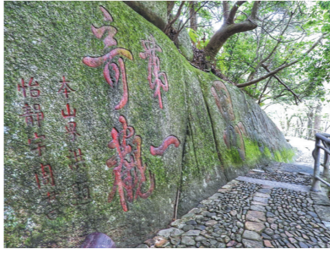
「第一奇观」摩崖石刻亦甚为可观

《大美中国》栏目欢迎投稿。稿件要求以纪实性的图片为主，紧扣“大美中国”主题，内容不限，可人可景可物。投稿请发至邮箱：ywdmzq@163.com，并请以“大美中国”为邮件标题，同时提供个人信息包括联系电话、身份证号码。