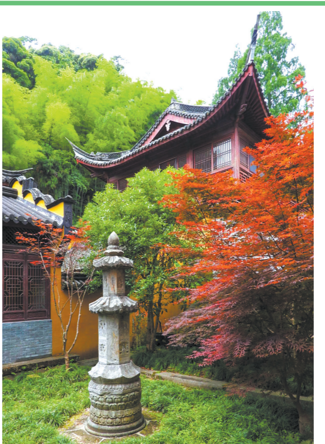
下方广寺庭院园林有唐代遗风

得出寺来，再请看导图，我们竟然仍有不少景点未去，颇有遗憾。然知足者常乐，留待下次再访，说不定还会另有新发现与惊喜呢。