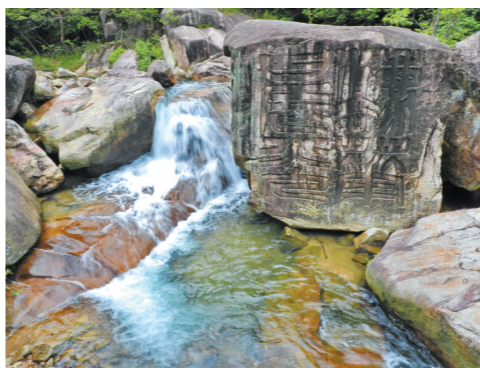
金溪流水相伴「法华晨光」巨印