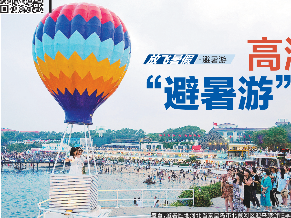
盛夏,避暑胜地河北省秦皇岛市北戴河区迎来旅游旺季