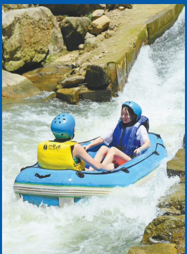
游客在浙江安吉山川乡仙龙峡景区体验漂流