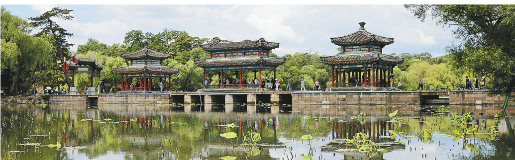
世界文化遗产承德避暑山庄

要数各大草原,热门如坝上草原、呼伦贝尔大草原、祁连山草原、巴音布鲁克草原、那拉提草原、希拉穆仁草原、鄂尔多斯大草原等,在近年来都有着极高的避暑人气。