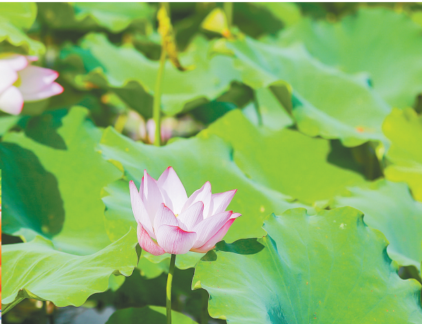
英德九龙峰林小镇荷花文化节

夏令营产品层出不穷,成为暑期旺季旅游市场新亮点。据广之旅介绍,今年上架的省内夏令营产品包括乡村生活体验、军事课堂、职业规划、体育运动等不同类别,深度沉浸式体验受欢迎。夏令营产品也不是纯粹的课程培训,而是与部分景点的深度结合,并且加插有游玩当中的动手体验环节,做到“游”与“学”相互均衡,趣味性和学术性并重。卖价从2980元至10800元不等,7月中至8月中前均多排期可供选择。