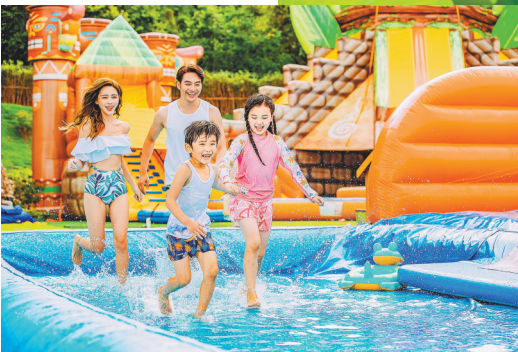
广州长隆水上乐园

7月23日-7月25日,佛山顺德长鹿旅游休博园将举行长鹿国潮音乐节暨非遗烟花秀,成人票:49.9元/人,儿童票29.9元/人,包含大门票+童话动物王国+非遗“打铁花”表演+国潮音乐节。其中,长鹿国潮电音节齐聚多位国内电音界大咖,国家级非物质文化遗产“打铁花”将有6台超大型铁花炉同时演出,营造华丽视觉盛宴。