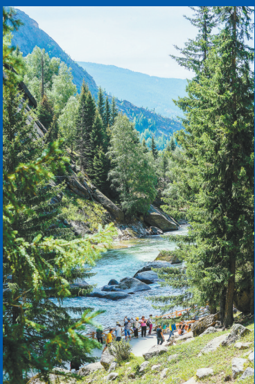
可可托海镇额尔齐斯大峡谷景区

随着“三伏天”的来临,我国多地迎来了一年一度的“避暑模式”。 根据中国气象网官方发布的消息,截至记者发稿时,我国江南、华南、新疆、内蒙古西部等地正持续经历高温天气,江南、华南中西部、江汉东部、江淮西部以及贵州东部、内蒙古中西部、陕西北部、宁夏北部、新疆盆地等地面临35℃以上高温,部分地区最高气温达37℃~39℃,局地40℃以上,高温黄色预警已正式拉响。 当“避暑”成为华南游客当前的“刚需”,去哪避暑,你想好了吗?