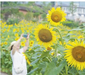
重庆市北碚区静观镇成片的向日葵花海

记者综合各方数据了解到,过往国内热门的避暑旅游目的地主要集中在海滨、山地、草原、湿地湖泊等自然资源类型,其中最受欢迎的