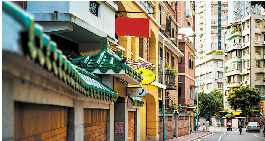
洋房建筑也采用琉璃瓦等中式建筑元素

1915年，美洲归侨黄葵石较早开始在东山开发房地产，他承领了一片官属荒地，平整后清出四条道路，然后将地块分割出售。随后，一班原籍开平的美国华侨先后到这里购地建房。这是归侨在东山置业的前奏。除了侨商个人外，还有更