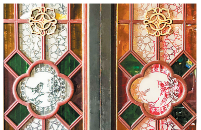
色彩鲜明的满洲窗 张永炎藏品