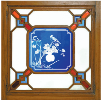
方胜八方海棠格心套蓝花草纹玻璃窗 晚清民国

满洲窗的出现使得岭南地区的居所环境得到有效的改善，从采光到装饰都达到人们的心理需求，色彩斑斓的满洲窗工艺构件得到了广泛的应用，并逐步进入广府地区乡村的富裕家庭。宗族祠堂、私家厅堂、居室都以装饰满洲窗玻璃窗门作为身份的象征。