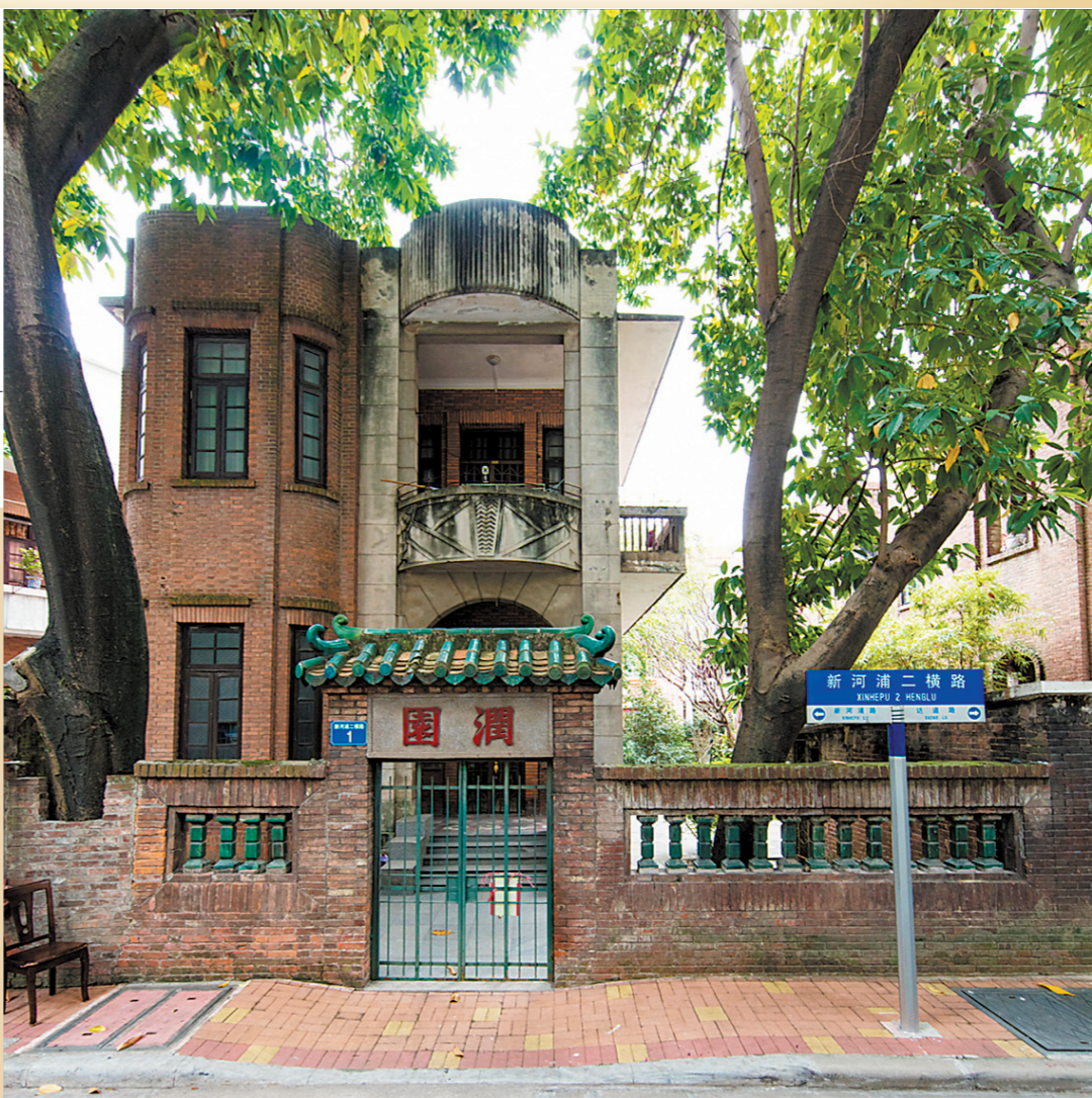
文/羊城晚报记者 施沛霖

在广州，有一群深爱着这些建筑的人们，他们或用数字化的方式，将历史建筑“珍藏”于“广州历史建筑地图”中；或以讲座或展览形式，向大众讲述这些建筑的前世今生；也有藏家收藏与历史建筑相关的图像、文献、建筑构件等，让它们的种种风貌留存于世。