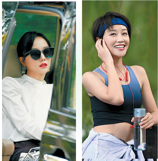
刚刚网剧首作遭遇口碑滑铁卢