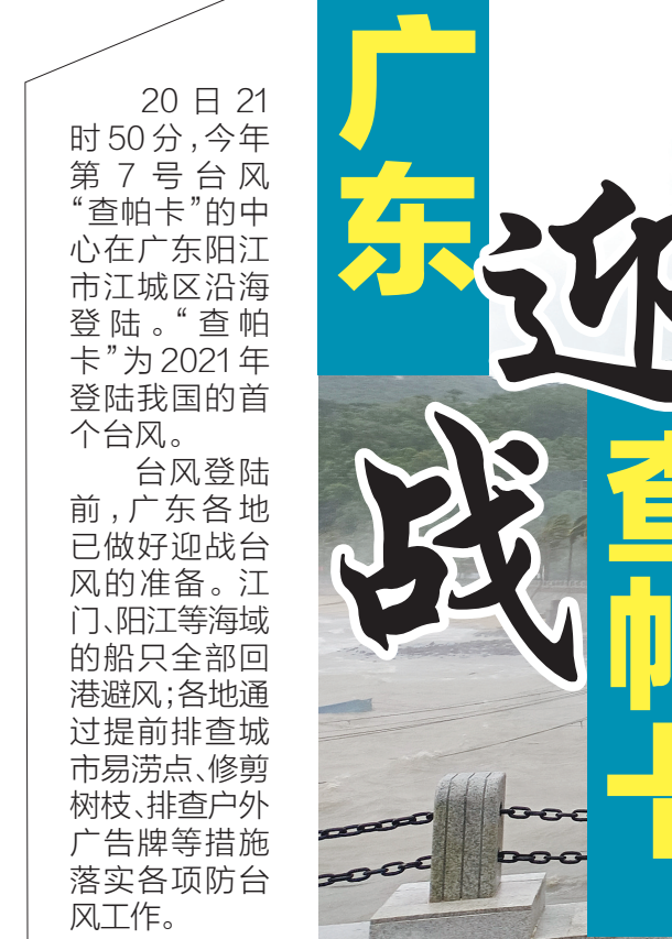
暴风袭击阳江东平大澳渔村

此外，市农业农村局还要求虎门、沙田等镇街加强渔船巡查和值班值守工作，指导渔船船主按照要求进行加固锚泊，做好防风避浪和渔船碰撞措施。局系统相关单位落实安排应急值班，密切监控东莞市海洋渔船动向，防止渔船违规出海。落实执法船艇备勤，以应对海上突发事件。