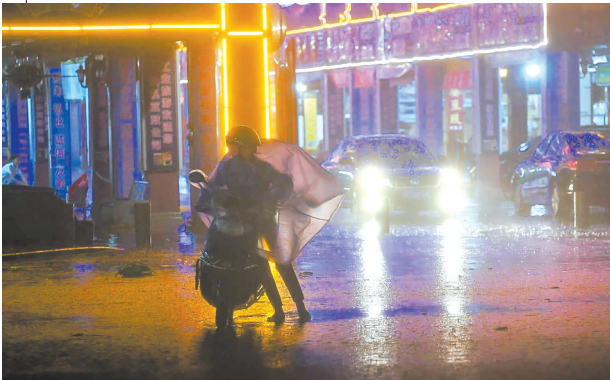
阳江，市民在雨中艰难前行