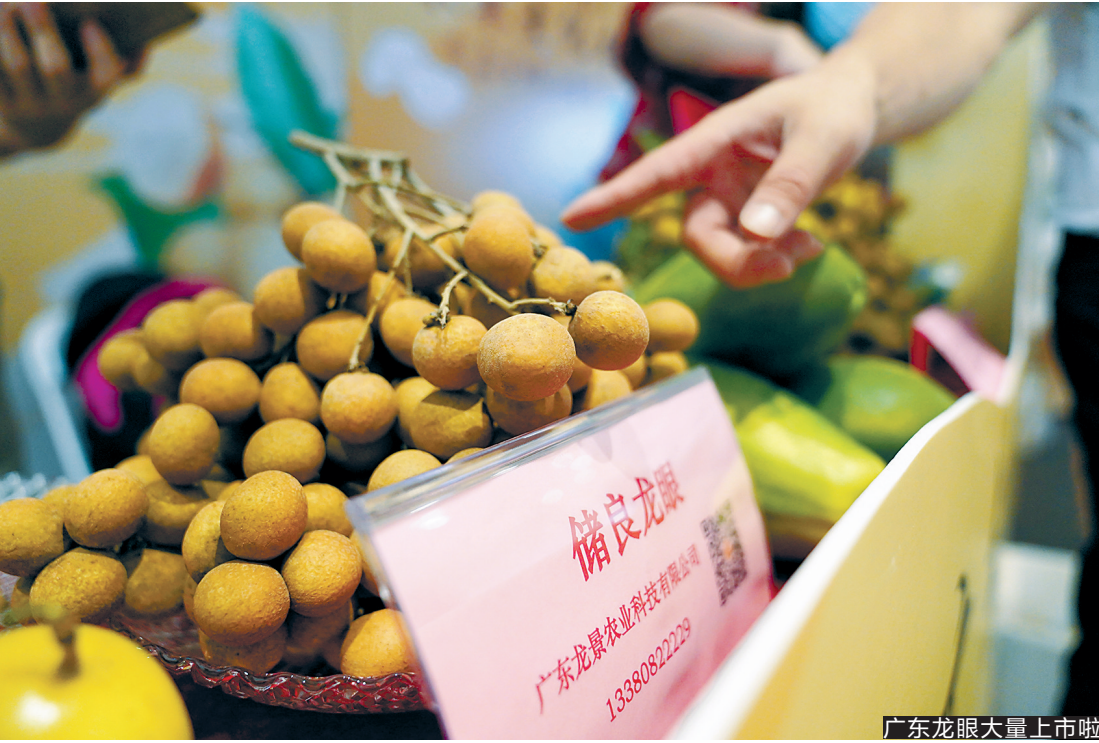
广东龙眼大量上市啦

活动现场，营养专家为桂圆打call。据其介绍，桂圆可以治疗贫血、心悸、失眠、健忘、神经衰弱及病后、产后身体虚弱等病症。同时，便携式罐装、袋装的桂圆肉、桂圆干既能作为休闲零食，又可以作为养生花茶、滋补汤的配料。