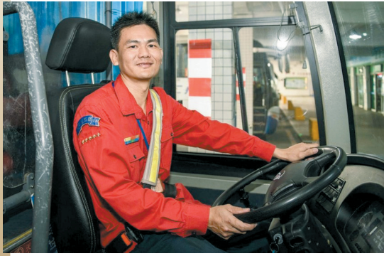
文/图 羊城晚报记者 周聪 通讯员 增宣