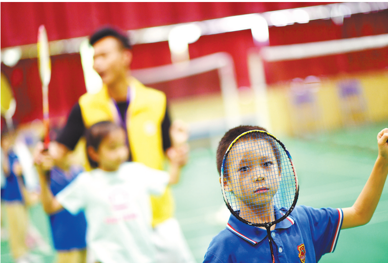
小北路小学(天香校区)暑期托管班学羽毛球的学生

首批开展暑期托管的学校大多分两期进行,每期持续10-12天。据悉,各区还将根据需求情况和实际效果,对暑期托管试点学校数量实施动态管理。