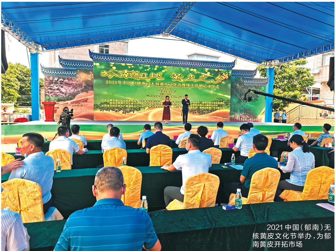
2021中国(郁南)无核黄皮文化节举办,为郁南黄皮开拓市场