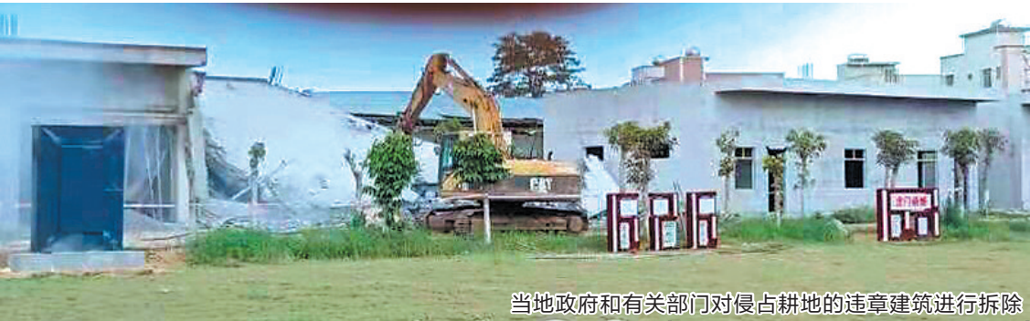
当地政府和有关部门对侵占耕地的违章建筑进行拆除

书,黄外村并未理会。于是,湛江市自然资源局依法向法院申请强制执行。2018年12月19日,湛江经济技术开发区区人民法院作出行政裁定:要求麻章镇落实此次强制执行工作。2020年,麻章区和麻章镇两级职能部门进行联合执法行动。