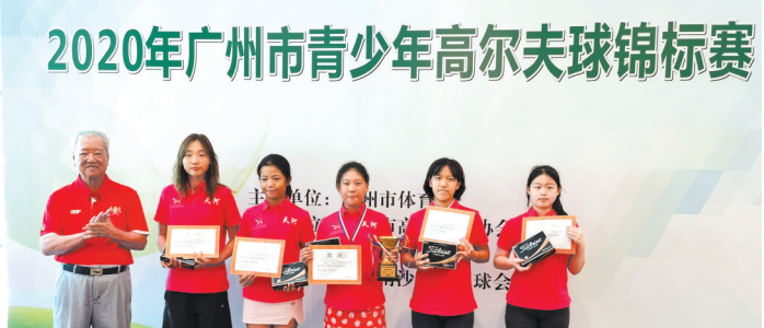
天河区青少年体育取得不错成绩

当老城区场馆数量不足时如何进行全民健身、青少年体育训练？如何发展特色优势项目？羊城晚报记者日前在进行广州市第十八届青少年运动会暨广州市第六届中学生运动会赛前巡区采访时，在天河区体育主管部门负责人、基层教练口中找到了答案。