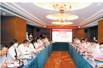
“侨批中的党史”学术研讨会上，各方专家围绕新视角，进行新解读