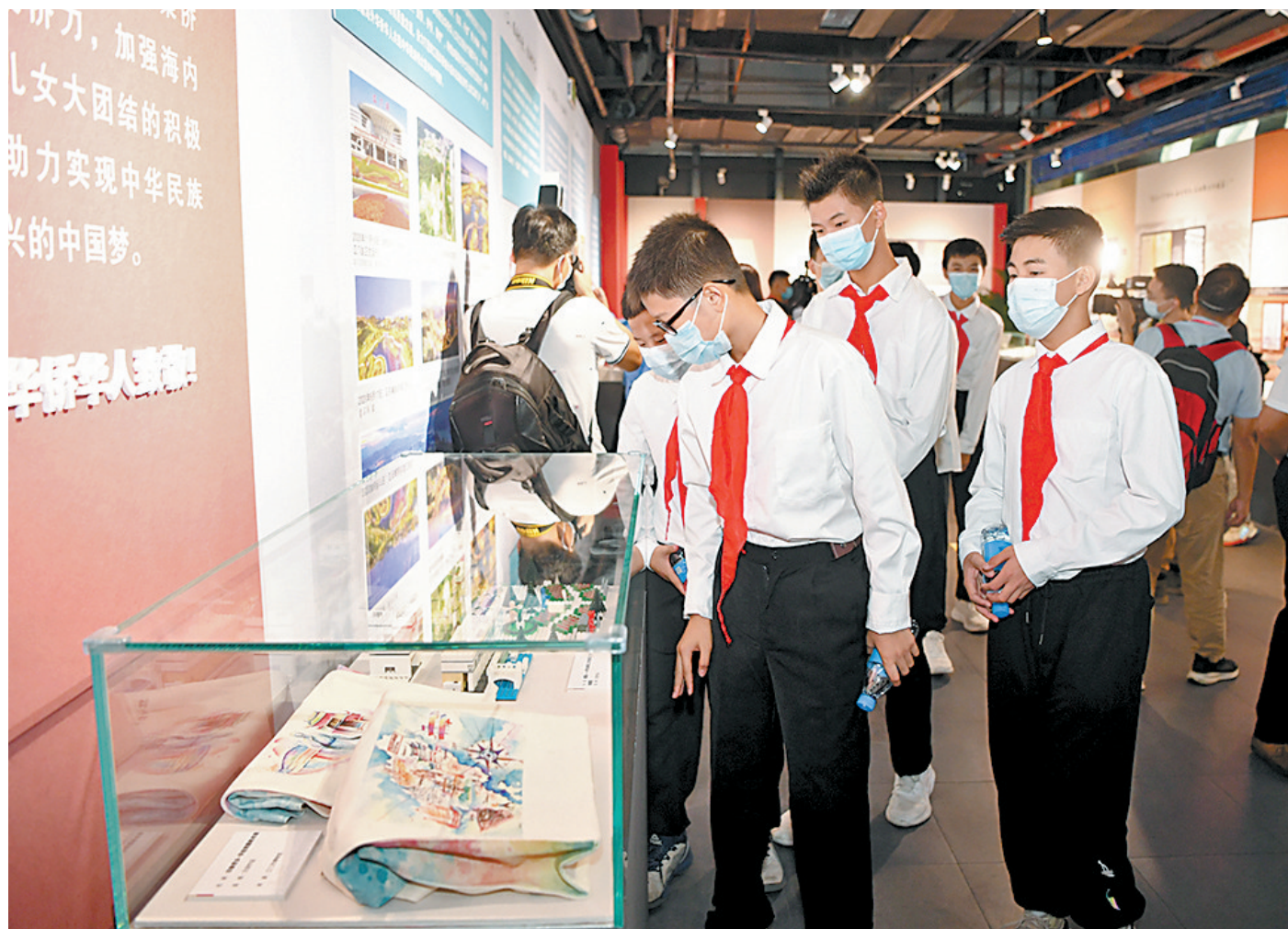
学生们参观在省博举办的专题展

一纸尺素，鸿雁传千里。蘸墨挥就的，是银两几毫、家长里短、生活琐事，渗透的却是家国百年风云变幻。侨心、初心心相印。百年以来，期盼民族独立、国家富强的五邑侨胞，与为人民谋幸福、为民族谋复兴的中国共产党，从“相知”“相识”到“肝胆相照”，每一步都“印”在了这薄薄一纸银信当中。侨批，成为了中国共产党百年来筚路蓝缕、缔造辉煌的真实写照。