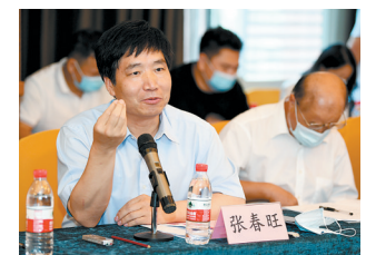
“侨批中的党史”学术研讨会上，各方专家围绕新视角，进行新解读

示，理解侨批与党史的关系，应着眼于从侨批记载日常生活的国际国内大背景下探讨中国共产党领导革命、建设与改革开放事业的历史必然性，理解华侨人支持革命、建设与改革开放事业的深层原因。 暨南大学华侨华人研究院教授张应龙认为，侨批中的党史研究不能忽视对侨汇的研究。侨汇对侨属和侨乡一直具有重要的意义，但不同时期侨汇对侨属和侨乡的作用形式有所不同。通过不同时期侨汇和侨汇政策的研究，也可以了解中国发展史、中国共产党与华侨的关系史。 而张春旺所长则建议，“侨批中的党史”研究除了研究侨批外，还可以加强华侨党员的研究，通过对他们的研究，不仅可以了解华侨的家国情怀，也可以了解党和华侨的联系。