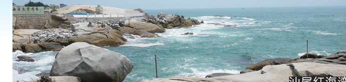
广东海岸线连绵,图为湛江鼎龙湾海滩

树上门屋、带独立花园泡池的别墅型等,私密性比较强。集体活动类的,建议选择配套和服务比较齐全的运动场,有会议室和其他的运动场地适合开展团建活动。现在很多温泉酒店推出的套餐价还包含自助餐和一些主题活动,省去不少筹备活动的麻烦。