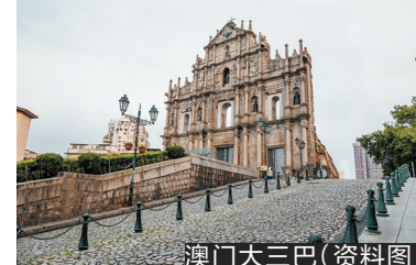
澳门大三巴(资料图)