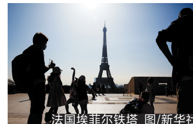
法国埃菲尔铁塔

在因疫情影响关闭近9个月后,法国首都巴黎的地标性建筑埃菲尔铁塔自7月16日起重新对游客开放。