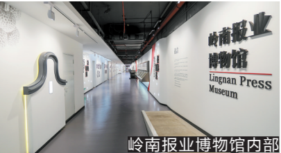
岭南报业博物馆内部

南海之滨，珠江两岸，一百多年来风云际会，改天换地，上演过多少跌宕起伏的历史故事，见证了多么新旧交战的思潮激荡。万家灯火，奔来眼底；百姓忧乐，激荡胸怀。一行行文字，一张张报纸，默默地记录着时代点滴、人间百态。岭南向海而生，近代以来既是商贸繁盛的锦绣之地，也是风雷震荡的革命策源地，文化的交汇碰撞，令这片土地勇立时代潮头，敢为天下之先。岭南报业发端于十九世纪，经历磨难，浴火重生，繁荣至今。从铅与火的奋进，到数与网的创新，岭南传媒始终记录时代风云，推动社会进步，为改革开放呐喊，并在新时代新征程中，书写着更为恢弘精彩的篇章。