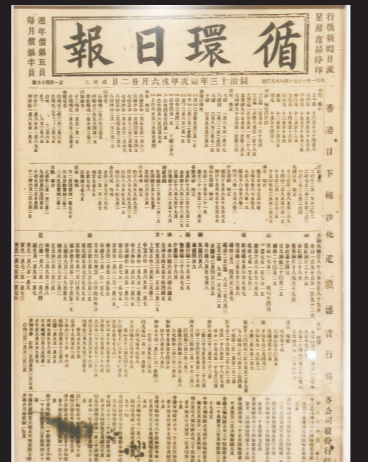
1874年王韬在香港创办的《循环日报》，是我国历史上第一家宣扬资产阶级政治改良主义思想的报纸