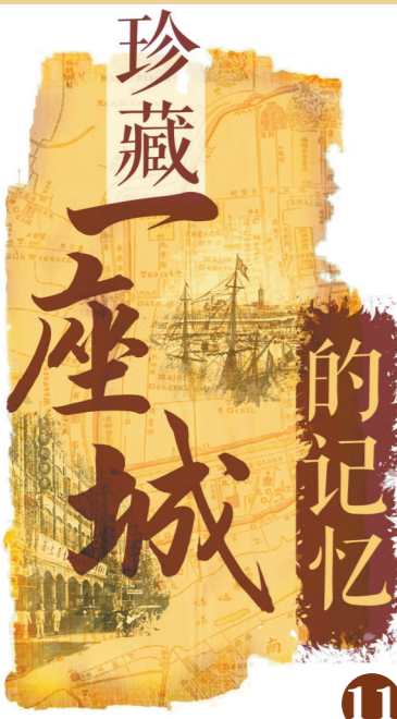
文/羊城晚报记者 梁恽韬 施沛霖