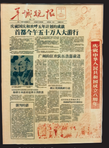
《羊城晚报》1957年10月1日创刊号