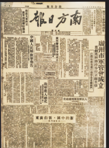
《南方日报》1949年10月23日创刊号