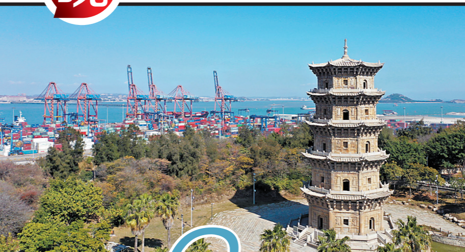
六胜塔，典型的元代建筑物，在历史上起着海上航标的作用

到了宋末元初，泉州一举超过广州，迎来了它的鼎盛时期。难怪马可·波罗来到泉州时，对其赞叹不已。不仅如此，展现在马可·波罗眼前的，是一个疆域空前辽阔，但却联系无比紧密的国度。为了维持庞大帝国的统治，元朝修运河贯通南北，修筑驿道便利交通。泉州的货物和海外舶来的奇珍异宝可以通过遍布全国的驿道系统，在内地迅速流通。