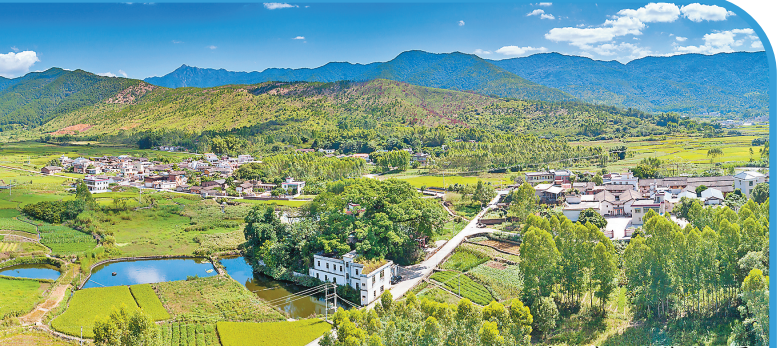
君山笔山脚下的蕉岭风景

巧遇爱唱山歌的老农，融诗廊遇词人客家曲调，吸一口天然氧吧的新鲜空气，哼一曲旋律轻快的歌谣，挥鞭驱赶水牛耕耘在天田间，让人感觉万物生灵自在其中，难怪这里能孕育出如此多的秀才、院士，能人辈出。