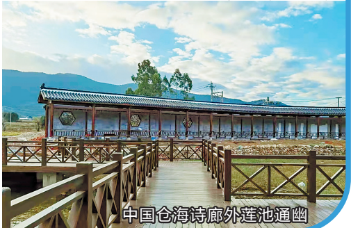
中国仓海诗廊外莲池通幽