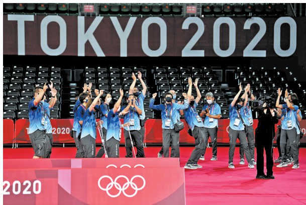
7月30日,羽毛球混合双打决赛开幕式前,志愿者们拍手给运动员加油。根据奥组委防疫要求,观看比赛不能呐喊助威,只能鼓掌