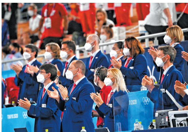
7月31日,男子蹦床体操决赛,运动员入场时,工作人员起立鼓掌