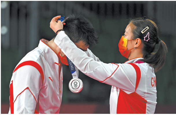
7月30日,羽毛球混合双打决赛,中国选手黄雅琼、郑思维获得银牌,根据奥组委防疫要求,为避免接触运动员,颁奖仪式上没有颁奖嘉宾,双打选手从托盘中拿起奖牌后互相给对方挂上奖牌