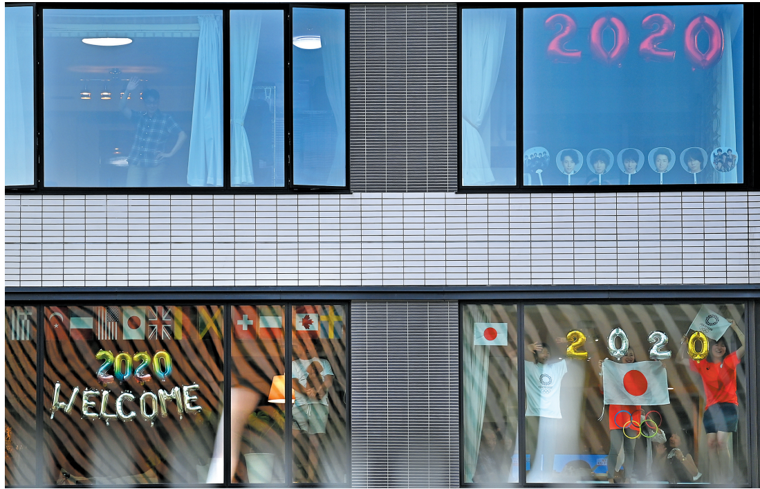
受疫情影响不能出门观看奥运会的东京居民,在家中欢庆奥运会开幕

国际奥委会主席巴赫说,东京奥运会成为隧道尽头的一束光。这束光或许不会彻底照亮黑暗,但至少在这个时刻,这届或许是奥运史上最特别的盛会,让全世界都紧密团结在了一起。