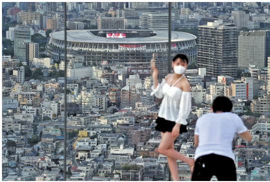
奥运会期间不少年轻人在SHIBUYA SKY拍照打卡