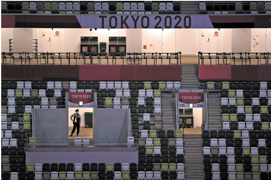
除少量相关工作人员参加外,东京奥运会开幕式采取无观众观看的方式举行,现场安保人员正在执勤