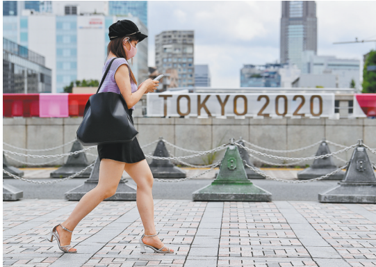
东京街头,一名戴口罩的女子从印有“东京2020”的标语前走过