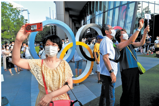
东京奥运会开幕当天,日本市民在奥运五环标志前合影留念