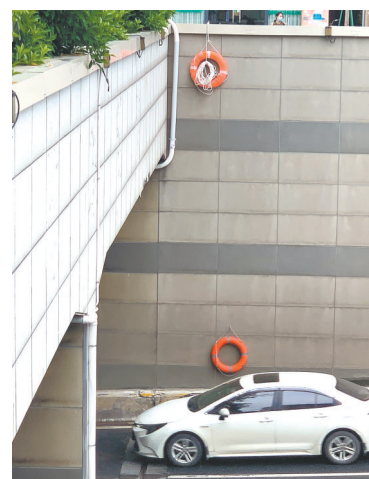
广州黄埔区中山大道东港湾路隧道,墙壁挂有救生圈

今后,道路内涝预报预警还将更精细化。今年6月起,广州市气象部门联合广州交警及各道路权属和养护单位对市区内部分易涝道路,以及大广高速、广州绕城高速、广河高速、珠三角环线高速、华南快速干线等高速公路进行现场调研。目前调研单位计划在具备条件的隐患路段建设交通气象站,对具备整改条件的道路制定整改措施。这将有助于气象部门更准确地预报可能导致“水浸街”的天气,并通过多媒体将预警信息精准发送到可能受影响的市民。