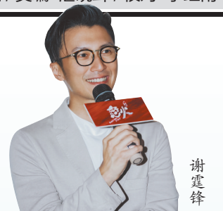
谢霆锋 敢跟着陈木胜 挑战极限

《怒火·重案》让近年醉心做菜的谢霆锋回归影坛，并交出一份漂亮答卷。这件事大概只有陈木胜才能做到：陈木胜与谢霆锋合作了《特警新人类》《新警察故事》《新少林寺》等多部影片，两人亦师亦友。陈木胜在影片拍摄后期查出鼻咽癌晚期，去年8月不幸离世，没能看到电影上映。