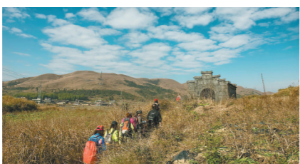
韶关乳源西京古道

文化遗产包括物质文化遗产和非物质文化遗产,是人类宝贵的物质和精神财富。岭南文化遗产源远流长,多姿多彩,凝聚了广东人的精神追求和民族情怀,对延续和发展中华文明、促进人类文明进步发挥着重要作用。这些丰富的岭南文化遗产,为人们利用活化提供了源源不断的资源。