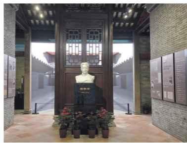
广州杨匏安旧居

入选“2020年度广东省文物古迹活化利用典型案例”的15个项目包括:广州杨匏安旧居活化利用项目、广州东平大押活化利用项目、广州邓村石屋活化利用项目、深圳大鹏所城活化利用项目、珠海会同祠及古建筑群活化利用项目、汕头中央红色交通线旧址活化利用项目、广州东平大押活化利用项目、韶关华南教育历史研学基地项目、韶关乳源西京古道活化利用项目、河源仙坑村荣封第活化利用项目、惠州东湖旅店活化利用项目、东莞寒溪水村古民居活化利用项目、广东省科技考古基地(江门陈白沙祠)项目、潮州广济桥活化利用项目、云浮兰寨古建筑群活化利用项目。