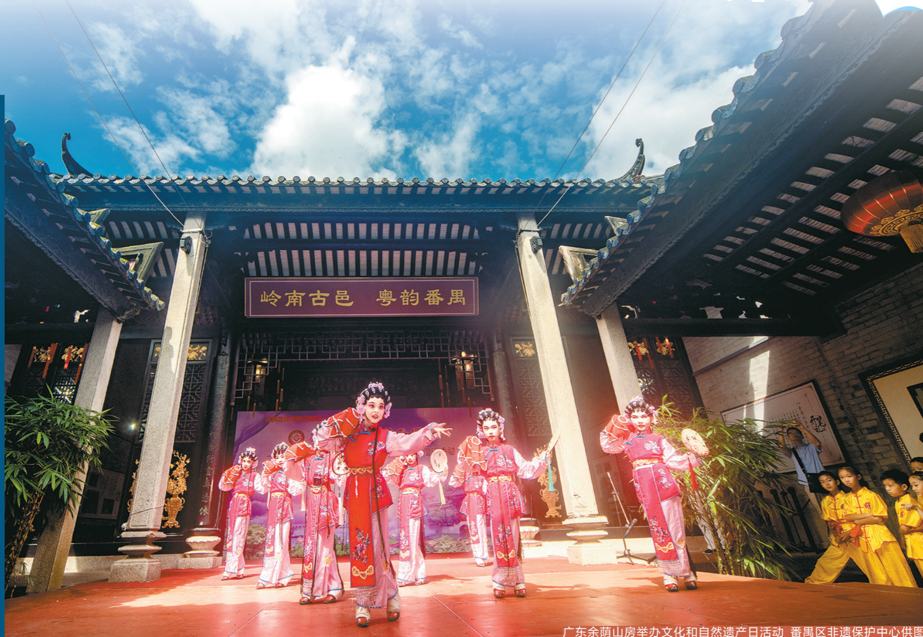
广东余荫山房举办文化和自然遗产日活动

近年来,广东对传承岭南特色文化,加强岭南文化遗产的活化利用,提升人民群众幸福感、获得感进行了积极探索和大量实践,取得了丰硕成果。