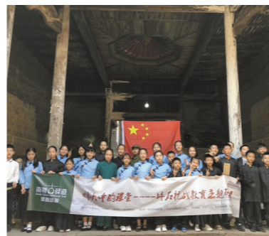
韶关华南教育历史研学基地