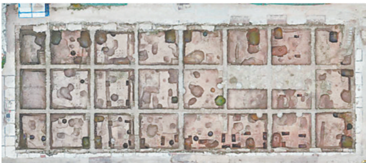
考古发掘广州市文物考古研究院提供

广东推进华南教育历史研学基地建设,在指导开展抗战时期华南教育历史史料收集和研究的的同时,活化利用研究成果。2020年中秋、国庆小长假期间,韶关、清远、梅州、云浮4市华南教育历史研学基地以游览观光、互动体验、研学教育等多种形式,每日吸引数千名游客到访。