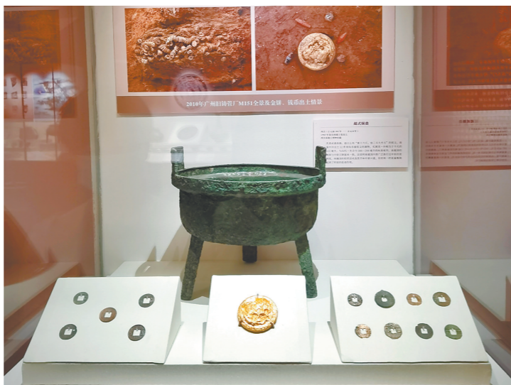
本次展览共展出广州地区出土的秦汉时期精品文物332件(套)

土、南越建国及帝国一统的历史进程；“四字同光”涵盖了汉、楚、越、胡等风格的器物。本次展览汇集西汉南越王博物馆等广州三家单位的秦汉文物精品，其中不乏丝缕玉衣、“文帝行玺”金印、“华音宫”印文陶片等珍贵文物。展览通过丰富的出土文物，反映出秦汉时期岭南社会的历史发展脉络，凸显了岭南社会多文化融合交流、兼容并蓄、和谐发展的时代特征，展现了岭南地区极富特色的古代饮食生活和丰富多元的礼仪文化内涵，为观众展现广州的悠久历史和深厚底蕴。