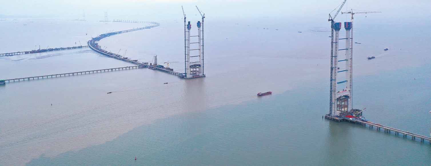
西主塔封顶后，深中通道中山大桥将持续推进东主塔建设(画面左侧为东主塔，右侧为西主塔)

翠亨新区马鞍岛侧，东塔位于广州市南沙万顷沙侧。目前，中山大桥西主塔已封顶，东主塔已施工至192米，计划9月封顶，后续，中山大桥将整体转入钢箱梁吊装上部结构施工阶段，为明年顺利合龙夯实基础。