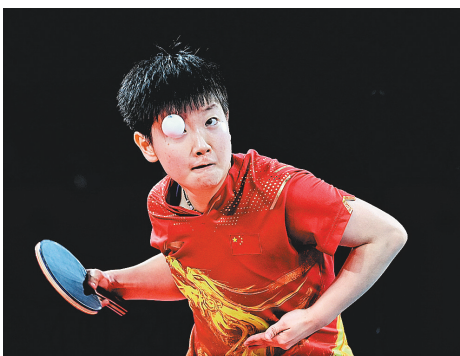
7月29日，女子乒乓球单打决赛中，孙颖莎在全神贯注地发球。