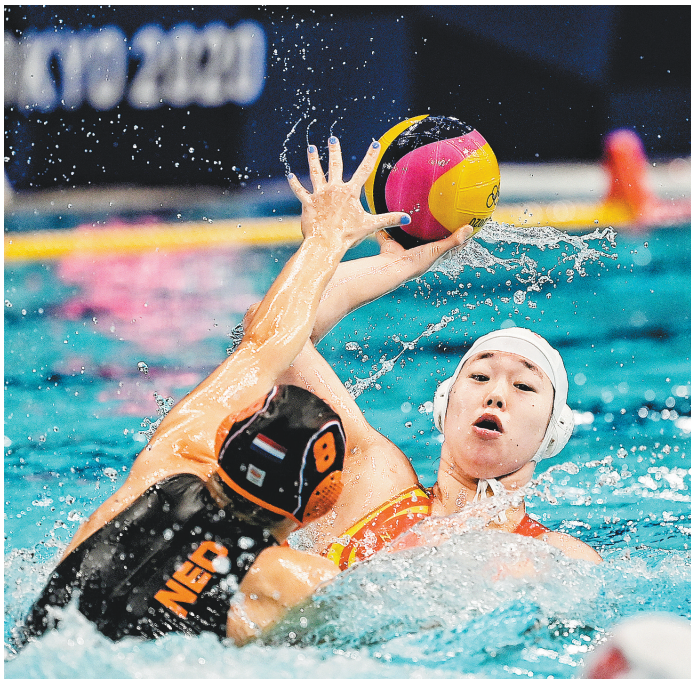
8月5日，东京奥运会女子水球排位赛中，中国选手在水中严防死守。