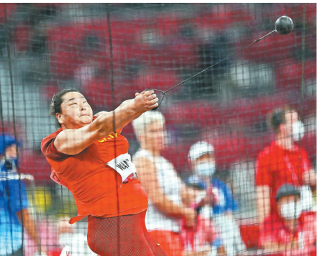
8月3日，东京奥运会女子链球决赛，中国选手王峥在比赛中奋力一搏。