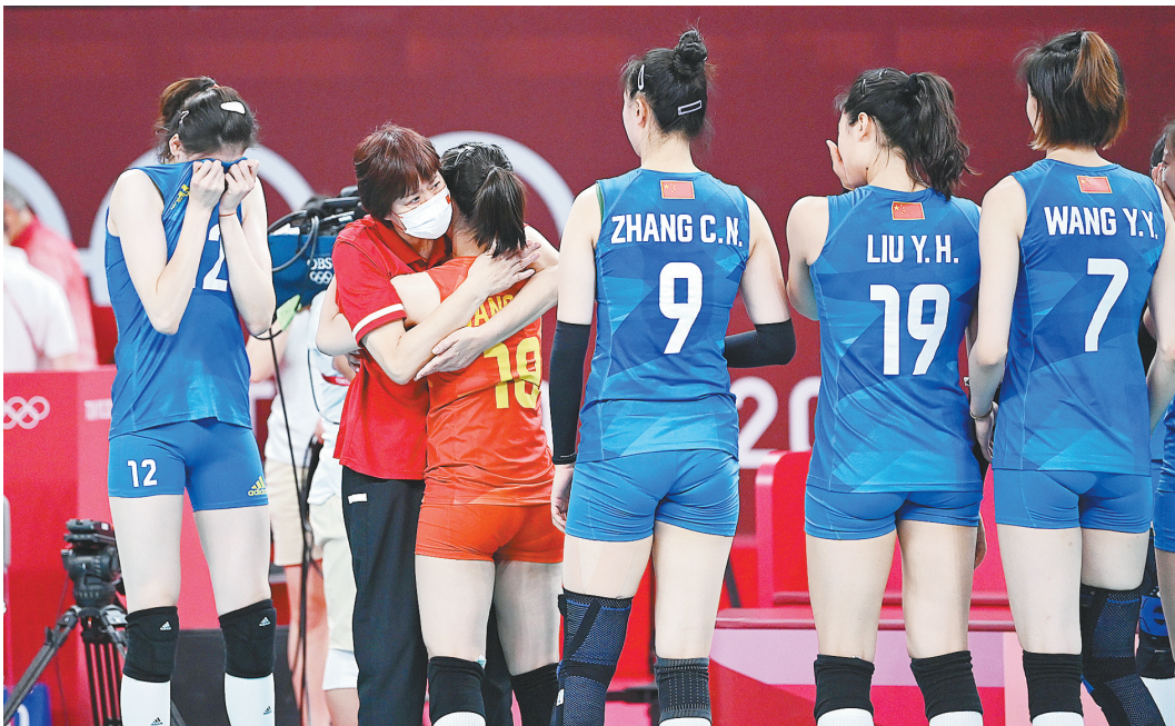
8月2日，中国女排迎来东京奥运会收官战。经过一番激战，中国女排3:0战胜阿根廷女排，郎平赛后和每个队员拥抱，队员们眼中饱含泪水。