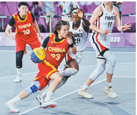
8月3日，东京奥运会女子三人篮球比赛中，中国队夺得了中国在该项目上的首枚奖牌。