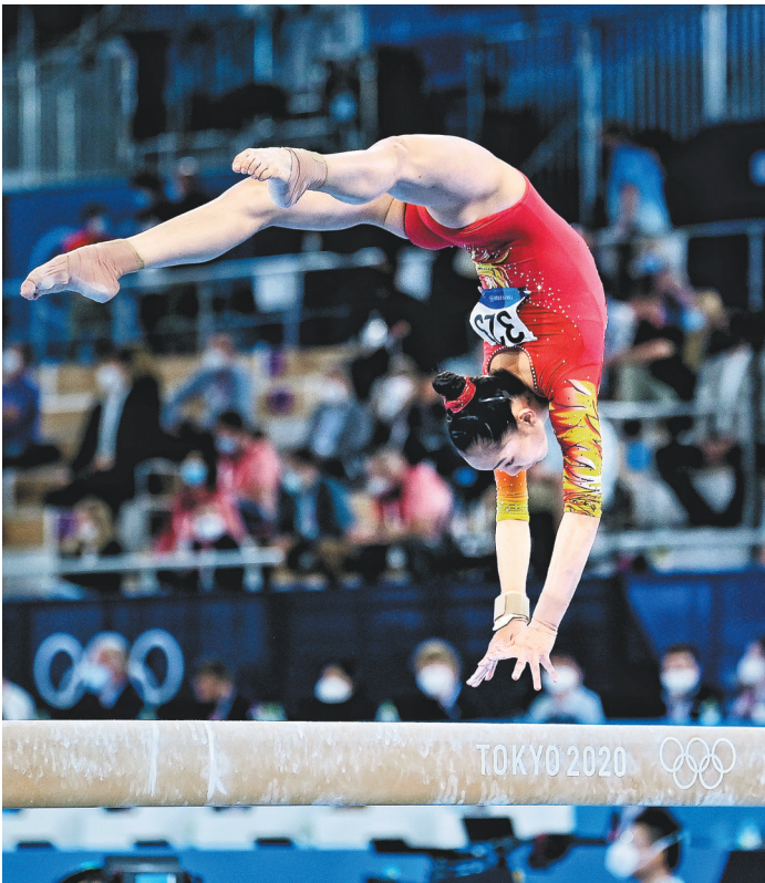
7月27日，体操女子团体决赛，中国健儿在平衡木上展现优美的身姿。