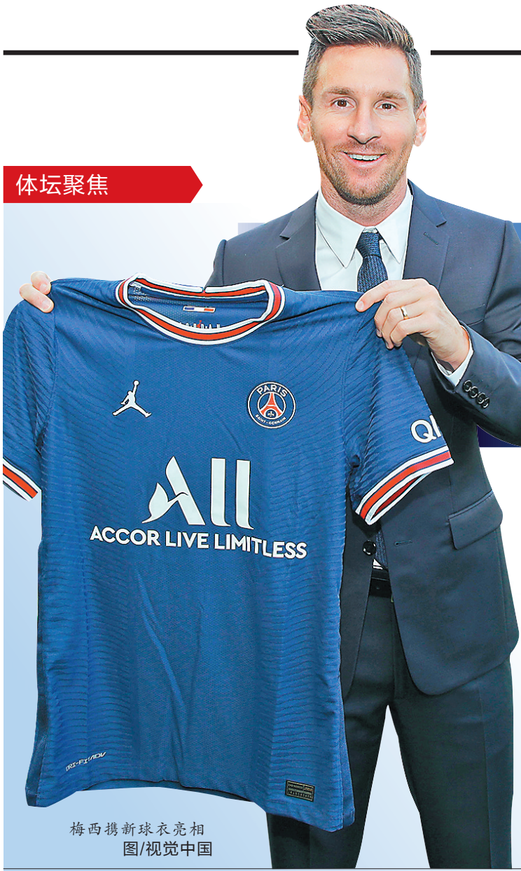
梅西携新球衣亮相

超级巨星梅西加盟巴黎圣日耳曼的消息昨天深夜终于官宣,双方签约两年,合同中还有续约一年的条款。梅西由于与老东家巴塞罗那合同同期满,他是零转会费加盟的大巴黎,“梅球王”的税后年薪约为3500万欧元。