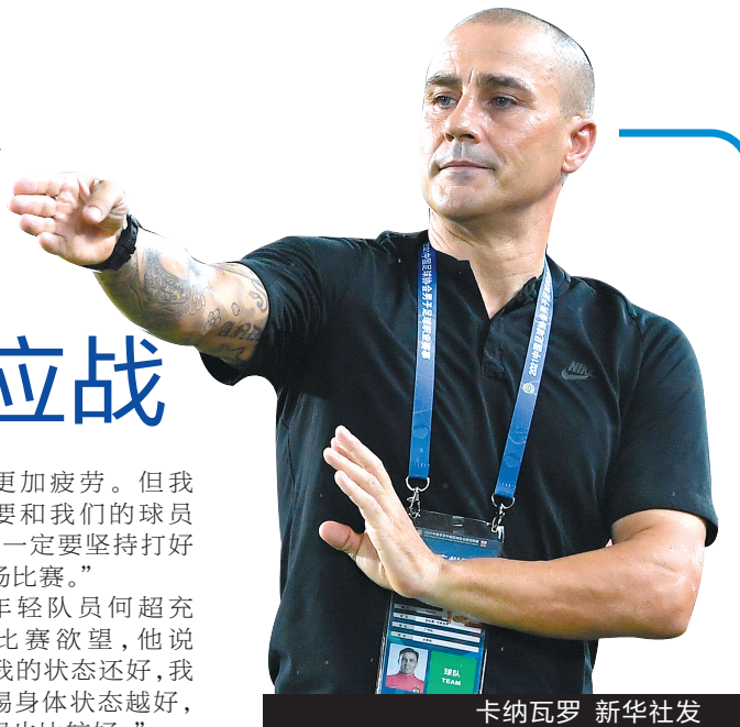
卡纳瓦罗