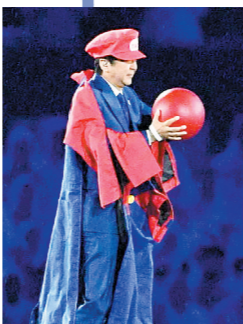
安倍晋三化身游戏人物