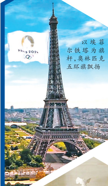
以埃菲尔铁塔为旗杆，奥林匹克五环旗飘扬