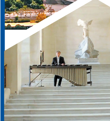
卢浮宫胜利女神像前传出悠扬的马林巴木琴声