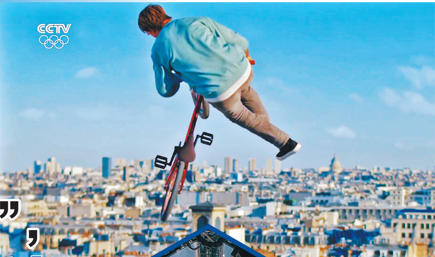
小轮车队队员从屋顶腾空而起，远处是巴黎天际线