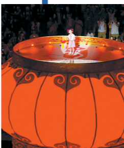
安倍晋三化身游戏人物