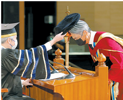
周润发获颁荣誉人文博士学位

在颁授典礼后，周润发出席分享环节，与约200名浸会大学学生对话交流。作为一名著名演员，他分享了演戏的成功之道：“我会分析每一场戏，在剧本做大量注释，逐步捉摸导演的感觉。有时我会把对白因角色而重写，做好足够准备。”他表示，演员要放下身段，以谦虚态度去协助导演。演员的职责是希望导演成功，并服务所饰演的角色，感动观众。而在分享会之后，一向亲民周润发更摆出经典自拍姿势，与一众年轻学生合影留念。