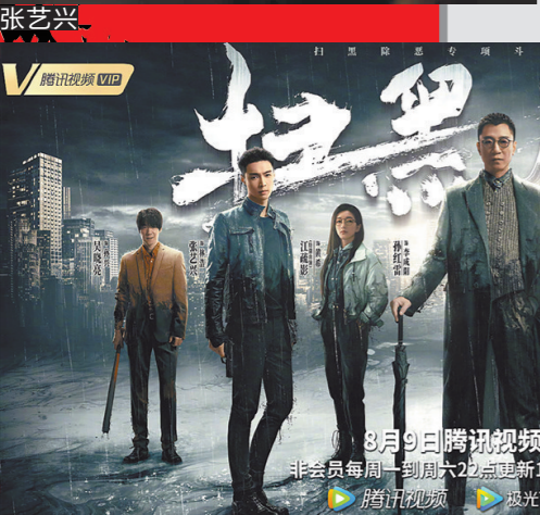
《扫黑风暴》口碑不俗