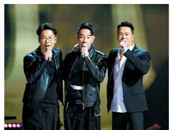
林晓峰、陈小春、谢天华(左起)