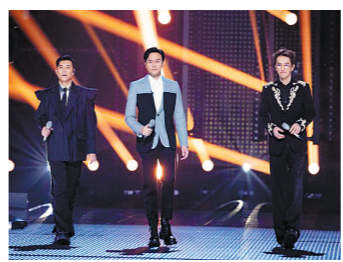
梁汉文、张智霖、林志炫(左起)