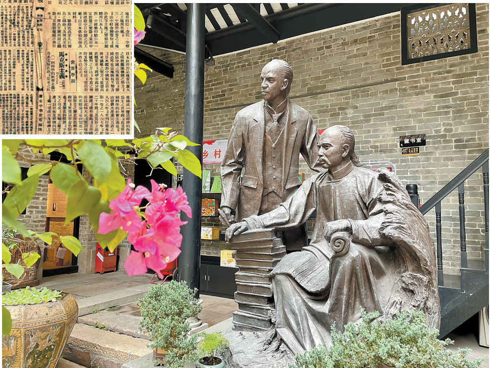
►康有为、梁启超二人对社会主义思想均进行了探索