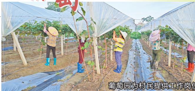
葡萄园为村民提供工作岗位

漫步在茂名化州市南盛街道谢村,处处可见秀丽景色。16日,记者走访谢村发现,谢村以党建为引领激励群众积极投身建设美丽家园,使乡村文化内涵和文明程度不断提升。如今,谢村通过种植葡萄发展高端农业,绘就一幅蒸蒸日上乡村振兴画卷。