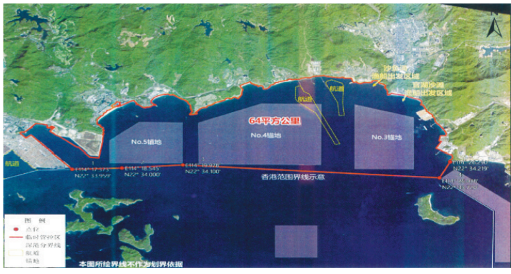
布氏鲸临时管控区

布氏鲸活动情况而适时动态调整。管控时间从8月16日起至布氏鲸离开大鹏湾海域为止,实施全天管控。