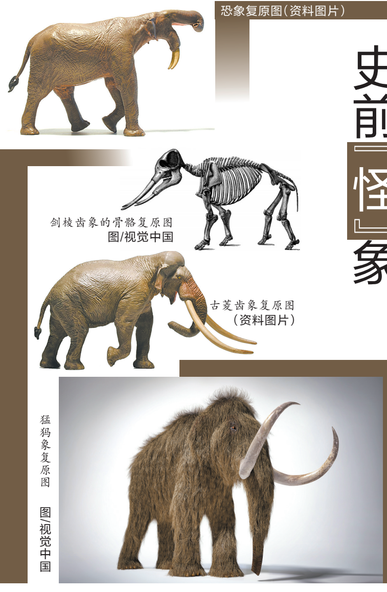
恐象复原图(资料图片)

大约距今3000万年前,非洲大地上出现了体型接近于现生大象的种类——古乳齿象。它的肩高超过2.2米,体重也超过3吨,和现在的亚洲象差不多,就连外貌特征也很相似。它的脸上长着一根长鼻子,嘴里也有一对较短的