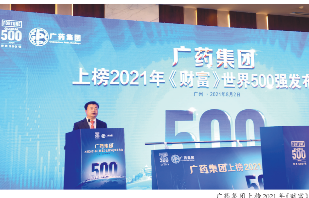
广药集团上榜2021年《财富》世界500强

8月9日，广药集团收到一封来自国家中医药管理局的贺信，祝贺其首次成功跻身2021年度《财富》世界500强榜单；与此同时，中国工程院院士、中国中医科学院院长张伯礼也发来热烈祝贺。之所以引来如此高规格关注，原因在于广药集团是全球首家以中医药为主业上榜世界500强的企业，可谓“一枝独秀”。 广药集团在中药业务方面别具特色，拥有12家中华老字号，其中有10家超过百年历史，数量占据全国医药行业老字号的半壁江山，被誉为中医药的“活化石”。其旗下不仅拥有421年历史并通过吉尼斯认证的全球最长寿药厂的“陈李济”，还有“中一”“奇星”“潘高寿”“王老吉”“敬修堂”等众多知名老字号品牌，在国际市场上享有盛誉，一批中药知名品牌以及众多独家“巨星”品种被打造出来，滋肾育胎丸、华佗再造丸、消渴丸、复