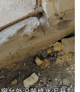
窗外沿装修水泥开裂