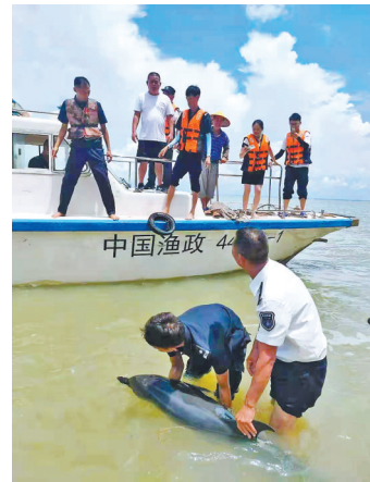
杨柑镇干部和渔政人员等正在营救海豚

面对因搁浅而惊恐不已的另一条海豚,救援人员和渔民巧用救生衣做担架,合众人之力,成功将海豚从搁浅处拖起,并