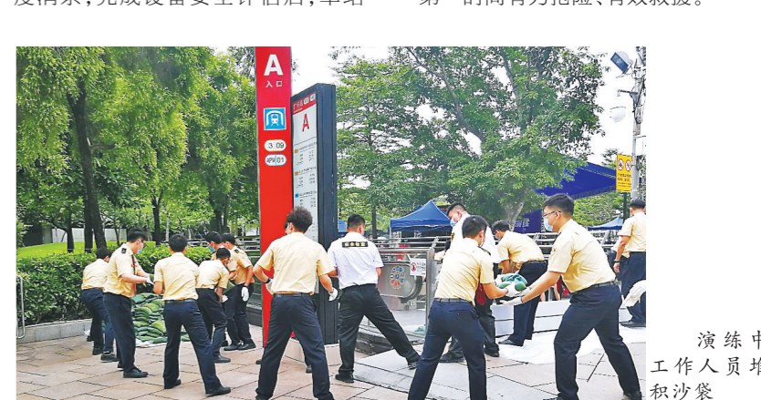
演练中工作人员堆积沙袋

导流;海珠区启动应急预案,成立现场指挥部,组织各相关成员单位进驻现场指挥部。各单位组成联合应急小组第一时间到达现场,迅速开展伤员救治、公交接驳、乘客疏散及安置救助、积水抽排等现场处置。随后,地铁工作人员对场地清洁,并进行防疫消杀,完成设备安全评估后,车站各相关出入口恢复通行。