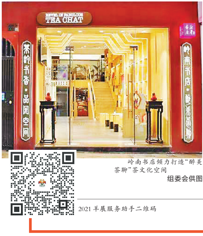
岭南书店倾力打造“醉美茶聊”茶文化空间