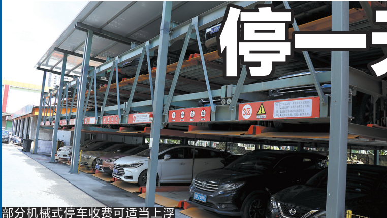
部分机械式停车收费可适当上浮