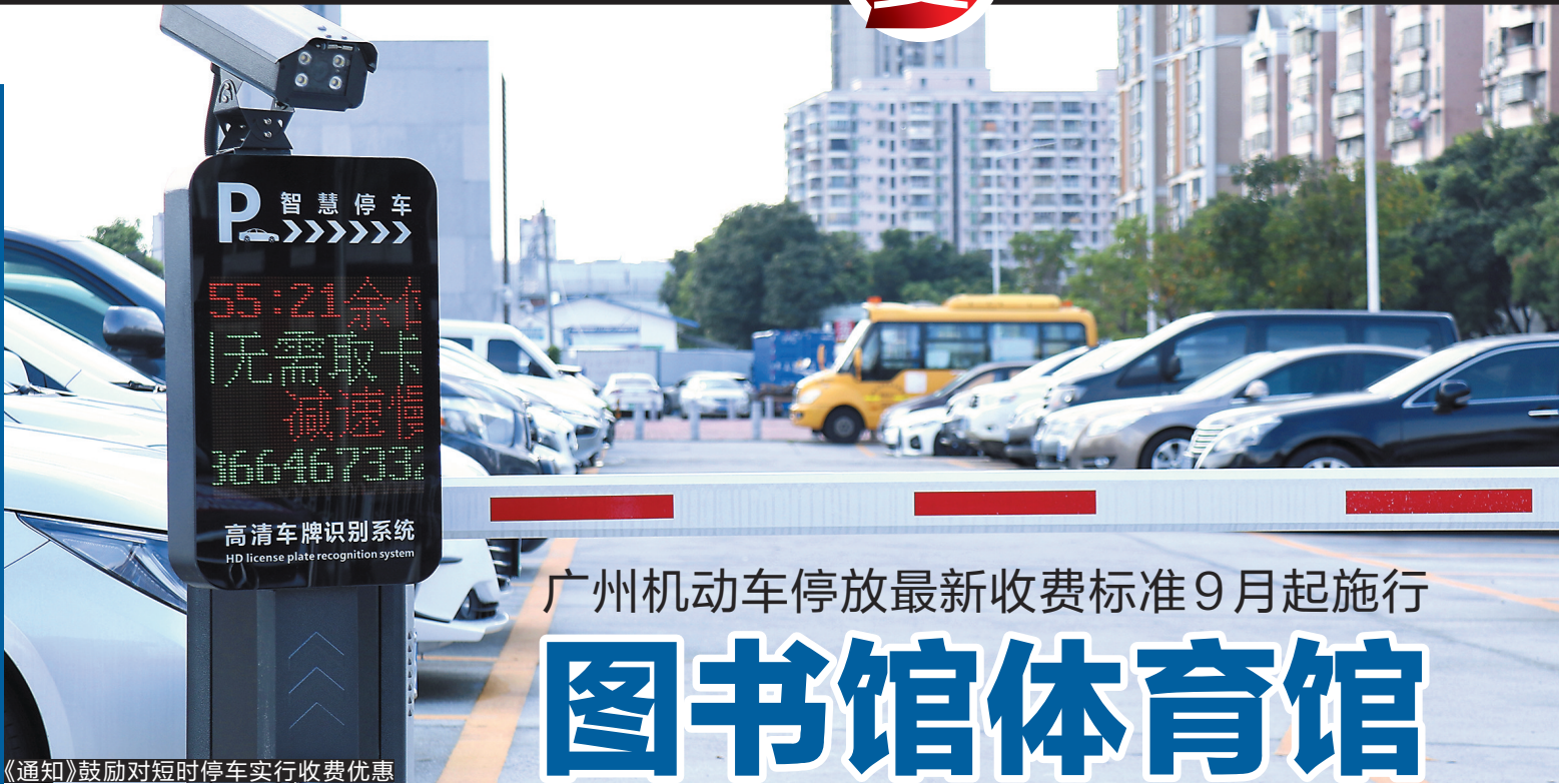
《通知》鼓励对短时停车实行收费优惠

据悉,具有自然垄断经营和公益性特征的停车场,其机动车停放服务收费实行政府指导价、政府定价管理。