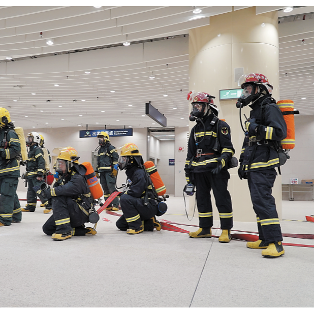
▶8月26日，珠澳双方人员进行救援工作