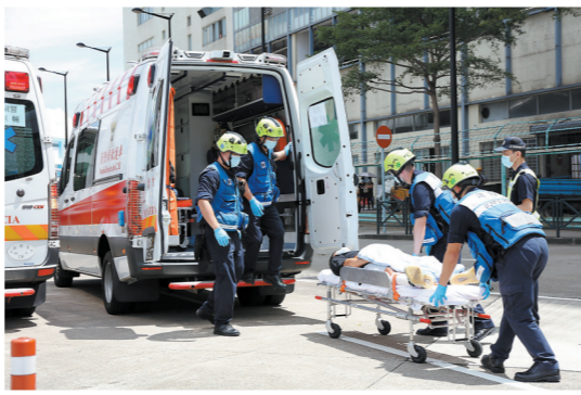
▲8月26日，澳门消防局人员在演练中运送受伤人员