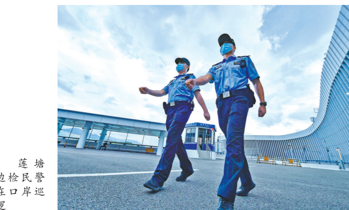
莲塘边检民警在口岸巡逻

莲塘口岸成立之时，莲塘边检站就肩负着打赢疫情防控阻击战的重要任务。为守好口岸边境“外防输入”第一道关，莲塘边检站协调建成深港公路口岸首个边检专用防疫方舱，多次参加疫情防控应急演练，涉疫处置能力有效提升。该站还启用货检入境场地“快捷通”信息备案采集点和视频伸缩检查镜，推行“无接触”式信息采集和车辆查验等，确保执勤人员个人防护安全。目前，该站阶段性实现民警职工零感染、口岸管控零差错、队伍管理零事故。